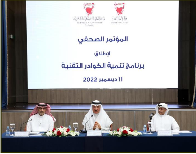
مؤتمر إطلاق برنامج تنمية الكوادر التقنية