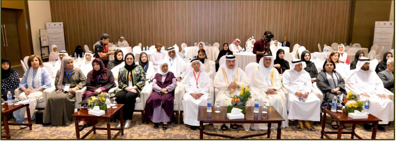
الملتقى الخليجي الثالث عشر للاجتماعيين