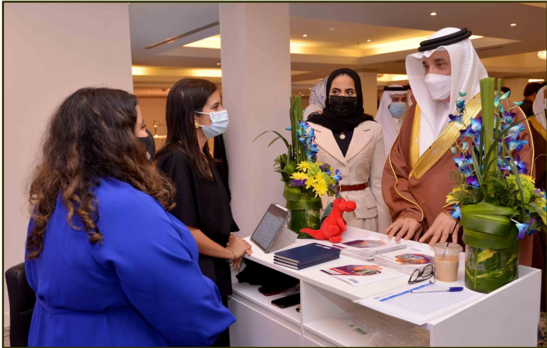
افتتاح معرض البحرين للتدريب والتعليم ما قبل العمل