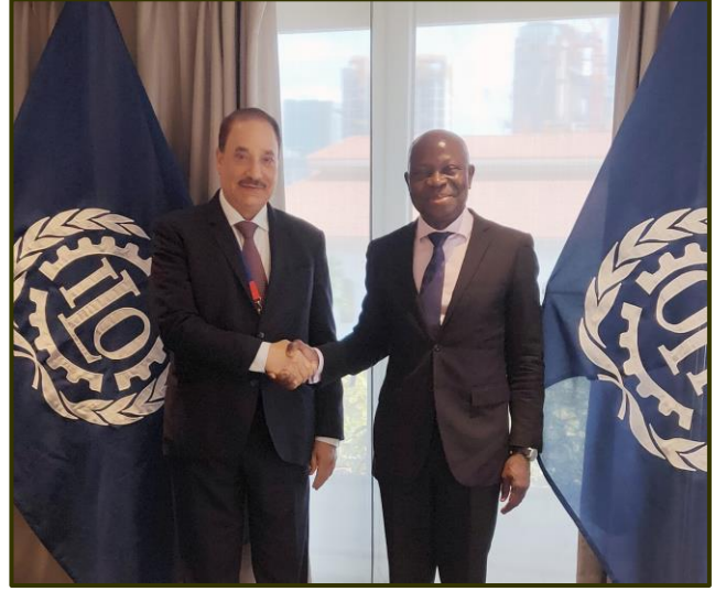
حميدان ملتقى المدير العام لمنظمة العمل الدولية في سنغافورة