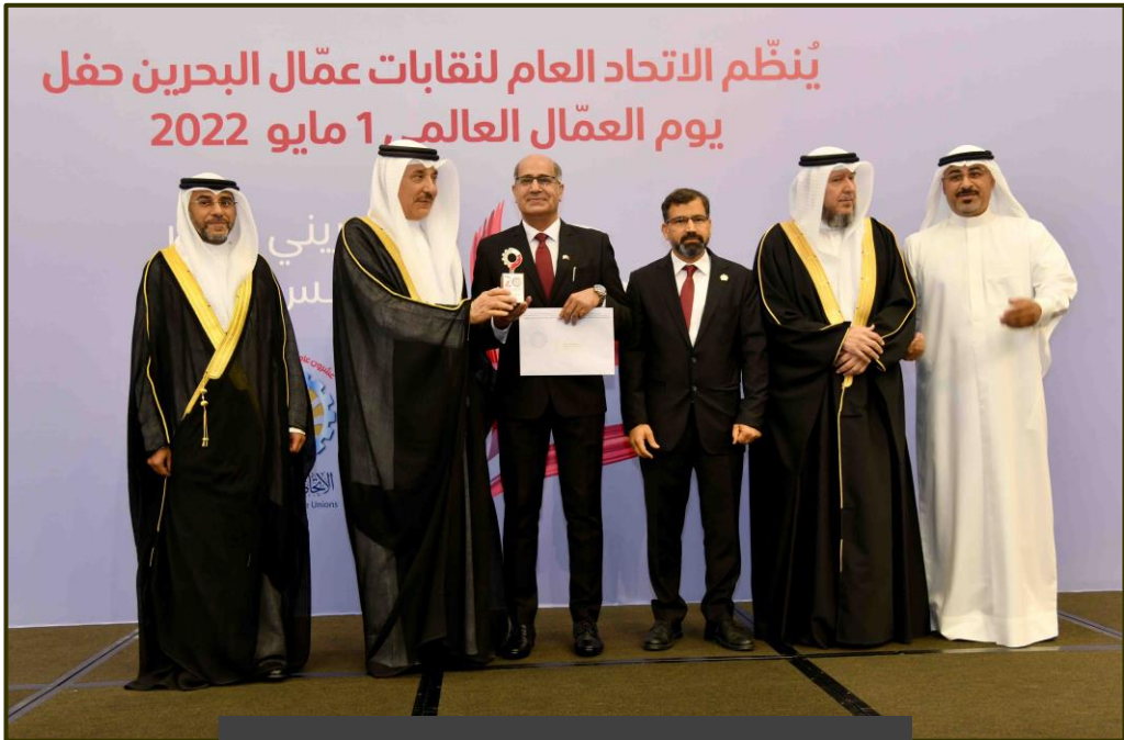
حفل يوم العمال العالمي الاتحاد العام لنقابات عمال البحرين