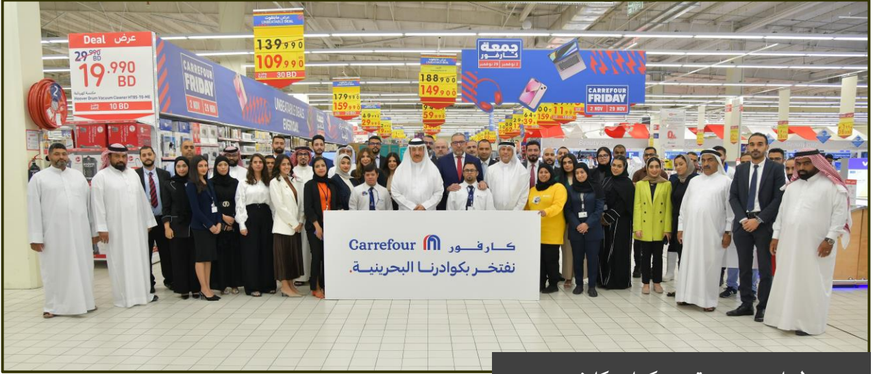
لقاء مجموعة من كوادر كارفور