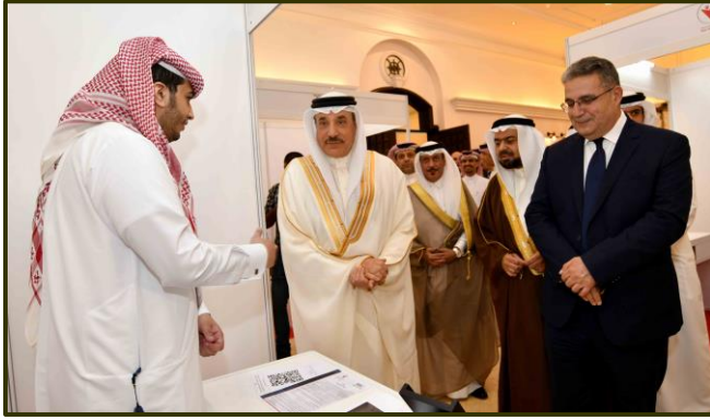
ملتقى ومعرض يوم المهن بجامعة العلوم التطبيقية