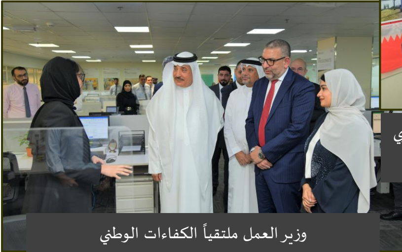
وزير العمل ملتقى الكفاءات الوطني ة لدى زيارته مقر مجموعة كارفور