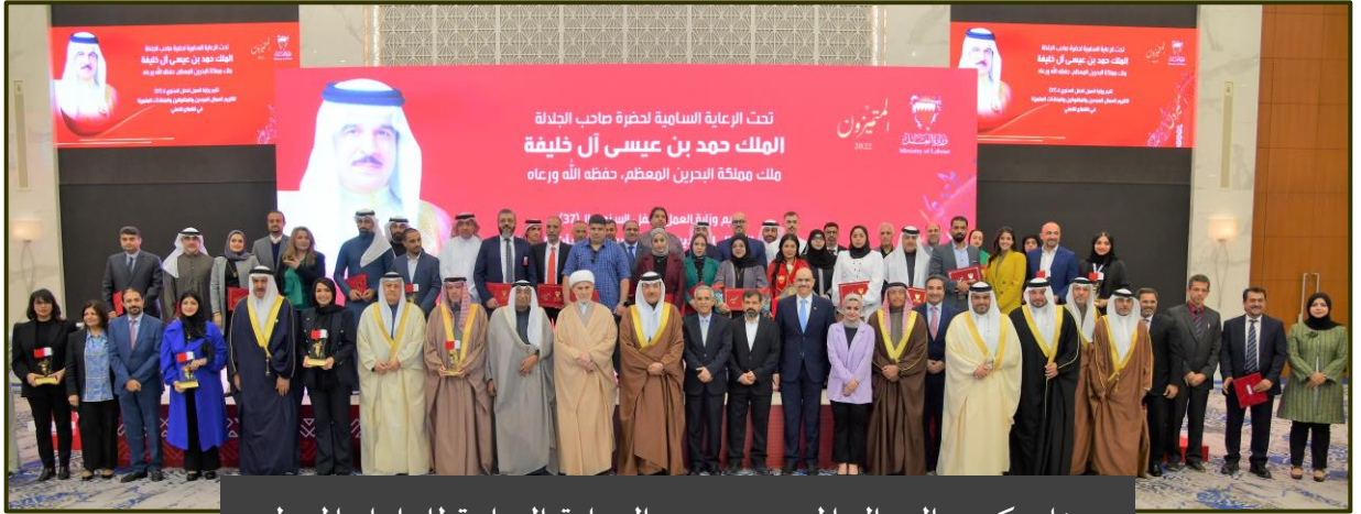
حفل تكريم العمال المجددين تحت الرعاية السامة للعاهل المعظم