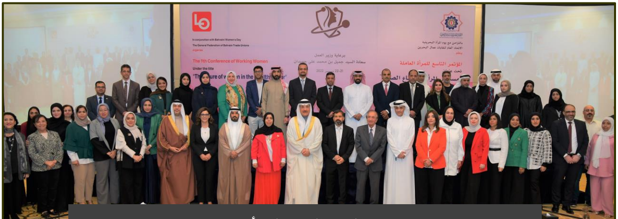
المؤتمر التاسع للمرأة