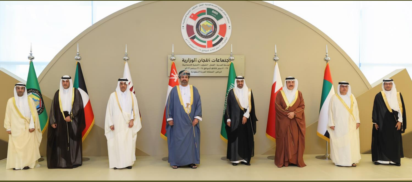
وزراء العمل بدول مجلس التعاون لدول الخليج العربية