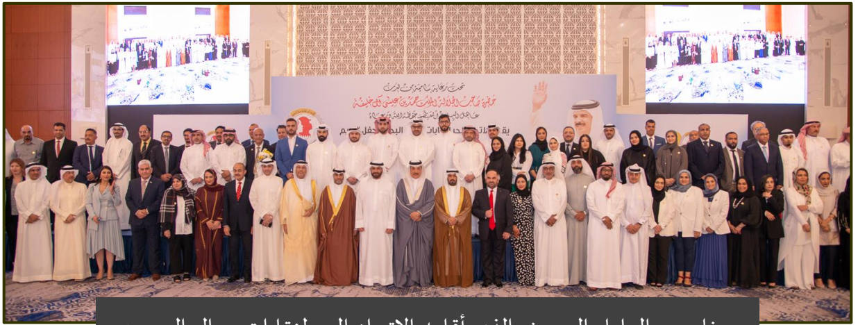
حفل يوم العامل البحريني الذي اقامه الاتحاد الحر لنقابات عمال البحرين