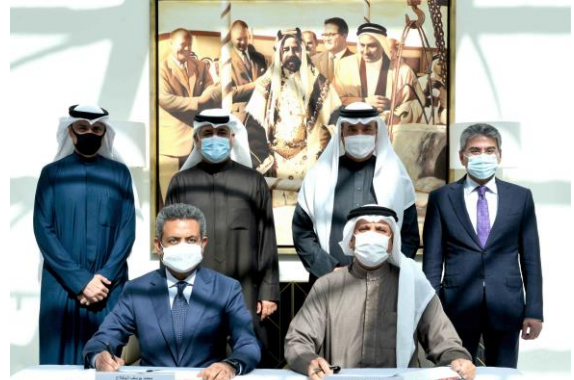
توقيع مذكرة تفاهم مع شركة هلا بحرين للضيافة لتأهيل المواطنين عبر برنامج فرص