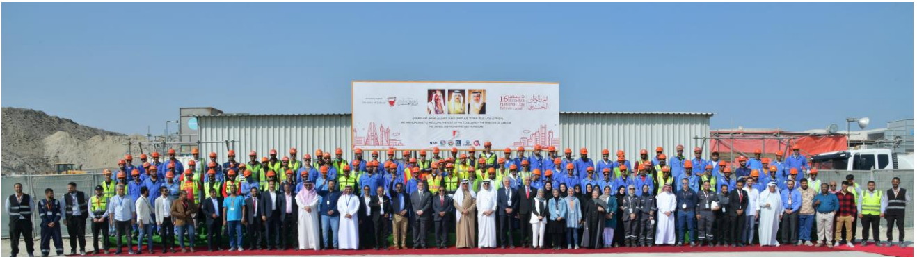
زيارة شركة ناصر الهاجري للاطلاع على جهودها في استقطاب المواطنين للعمل بمختلف أقسامها