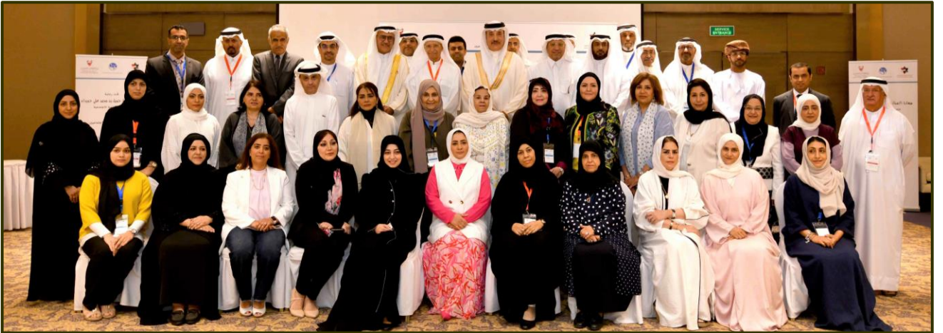
الملتقى الخليجي الثالث عشر للاجتماعيين