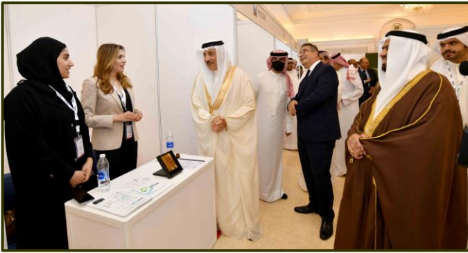
ملتقى ومعرض يوم المهن بجامعة العلوم التطبيقية