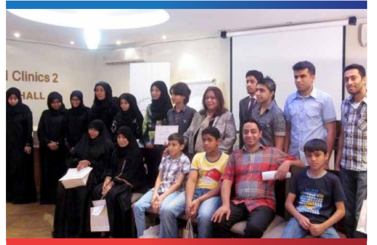
تدريب الأطفال على التعامل مع مرض السكري في مخيم شروق

اقتصار برامج التدريب على مجالات محددة هي برامج الحاسب الآلي واللغة الانجليزية والتقوية في الرياضيات والمواد الأخرى. وعلى الرغم من أن مثل هذه البرامج تدعم المتدربين وتصلق مهاراتهم إلا أنها لا تضمن الحصول على الكفاءة المهنية الخاصة للتمكن من الحصول على مهنة مستقرة ومناسبة لهم. على الرغم من أهمية المشروع في تمكين الفئة المستهدفة فإنه يفتقد إلى نظام للمتابعة بعد عمليات التدريب التي يخضع لها المريض وكذلك نظام المتابعة مع جهات العمل للتعرف على الظروف التي يعمل بها ونتاجيته واحتياجاته للتدريب أثناء الخدمة وما توفره جهة العمل من امكانيات مادية ومعنوية لتسهيل عمله ورفع انتاجيته. الدعم الذي تحصل عليه الجمعية منخفض لهذا البرنامج ويكاد يقتصر على الدعم المالي من وزارة التنمية الاجتماعية وجهات محدودة في مجال التدريب. الحاجة إلى التنسيق والتعاون مع جهات متعددة في الدولة لتفعيل البرنامج، ولا تعرف الجمعية كيف يمكنها ذلك مثل تمكين، بنك الأسرة، معاهد تدريب متخصصة مثل المعهد الأمريكي واكاديمية دلون ومعهد العاصمة وغيرها.