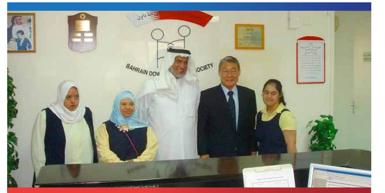
وحدة التدخل المبكر في الجمعية البحرينية لمتلازمة داون

وللتدخل المبكر كذلك أثر بالغ في تكييف الأسرة والتخفيف من الأعباء المادية والمعنوية نتيجة وجود حالة الإعاقة لديها، إضافة إلى التأكيد على أهمية مشاركة الأسرة وإبراز دورها الأساسي في تقديم المعلومات الضرورية وإسهامها في تنفيذ تلك البرامج.