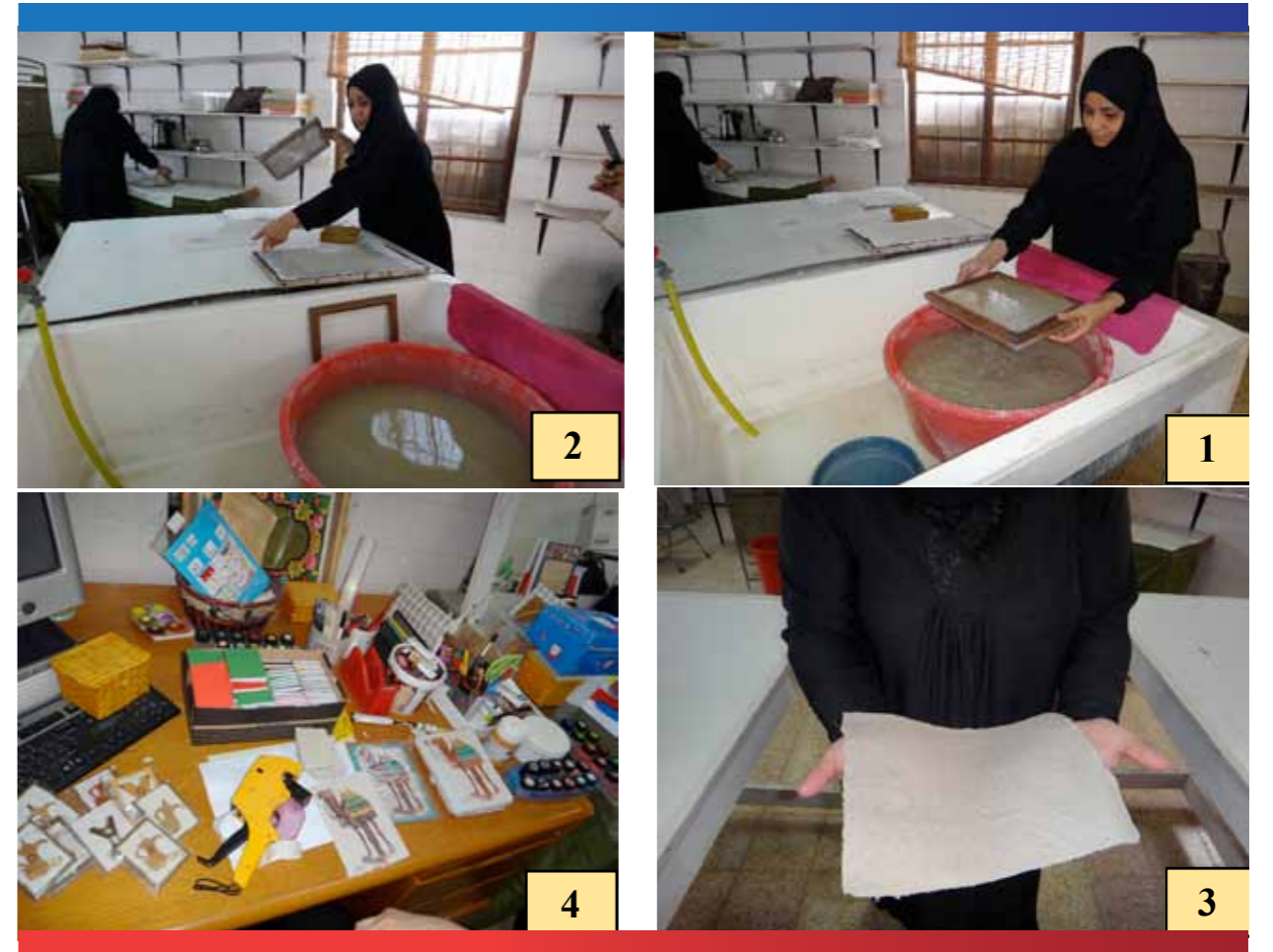
صناعة الورق من سعف النخيل - مراحل العمل بعد التجفيف