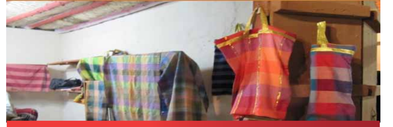
جهاز النسيج والمنتجات