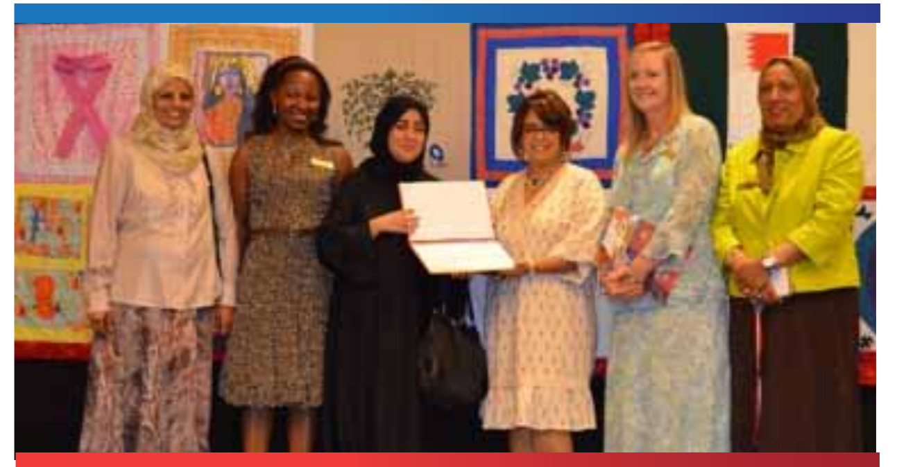
عرض ملحف البحرين (Bahrain Quilt)