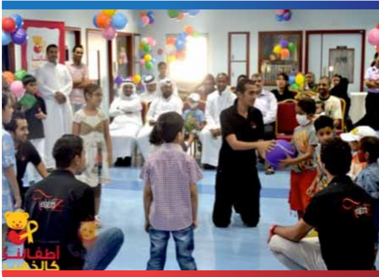
صورة معبرة عن نشاطات برنامج ابتسامة

البرامج المستقبلية لمشروع «ابتسامة»: توفير أخصائي دعم اجتماعي دائماً للمبادرة بوحدة عبد الله كانو بالسلمانية. تدشين حقيبة ابتسامة. بناء وتجهيز غرفة لأولياء الأمور بوحدة عبد الله كانو. إعادة تصميم وتجهيز غرفة الألعاب بوحدة عبد الله كانو. تدشين مشروع «أبجد» التعليمي للأطفال بوحدة عبد الله كانو. توفير قاعة بيانات محدثة للأطفال المصابين بالسرطان والأطفال المتعافين. القيام بزيارات إقليمية للتعرف على التجارب المماثلة وذلك لتبادل الخبرات. تدشين مبادرة «ابتسامة» في عدد من دول مجلس التعاون. تدشين الموقع الإلكتروني الرسمي للمبادرة.