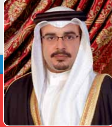
صاحب السمو الملكي الأمير سلمان بن حمد آل خليفة ولي العهد الأمين النائب الأول لرئيس مجلس الوزراء نائب القائد الأعلى لقوة دفاع البحرين