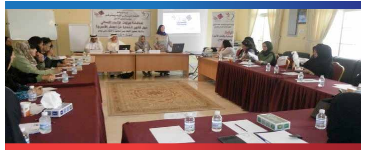
ورشة مناقشة مرثيات الاتحاد النسائي البحريني حول قانون الحماية من العنف