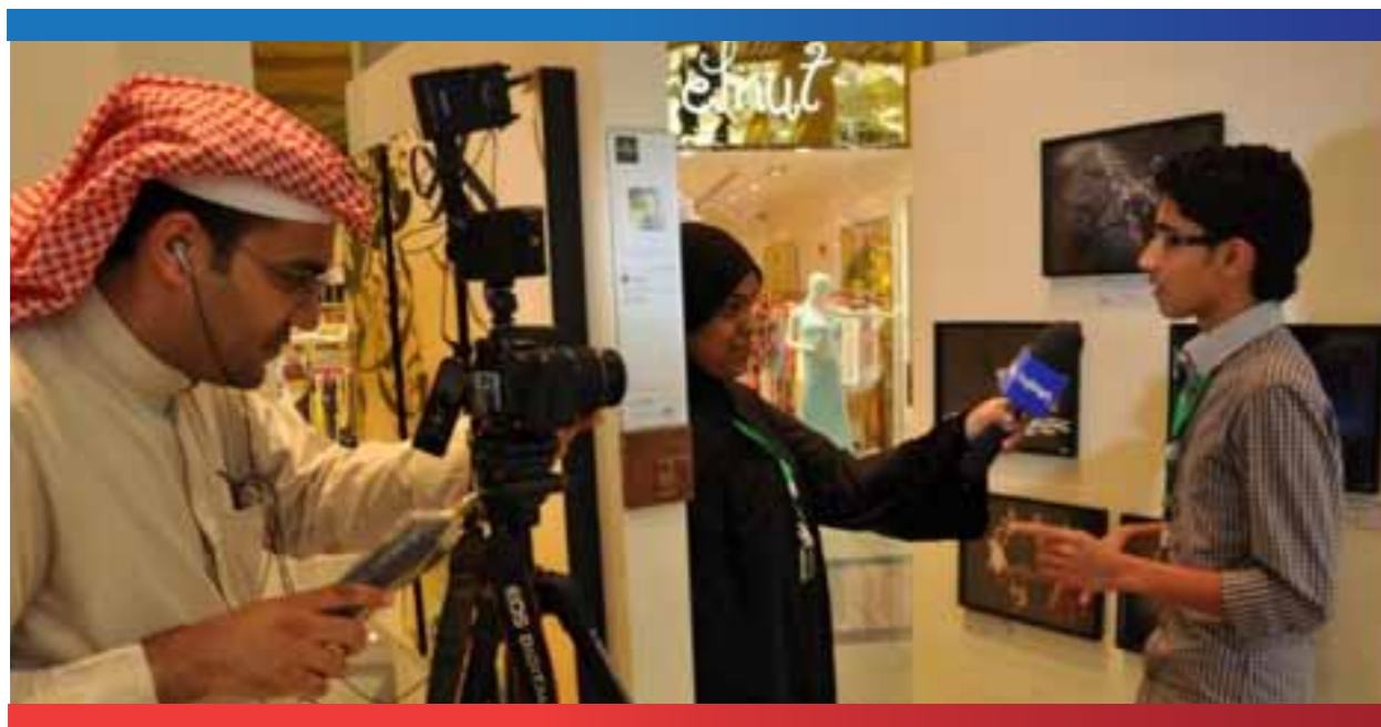
معرض الصور الفوتوغرافية (مشروع هنا البحرين)