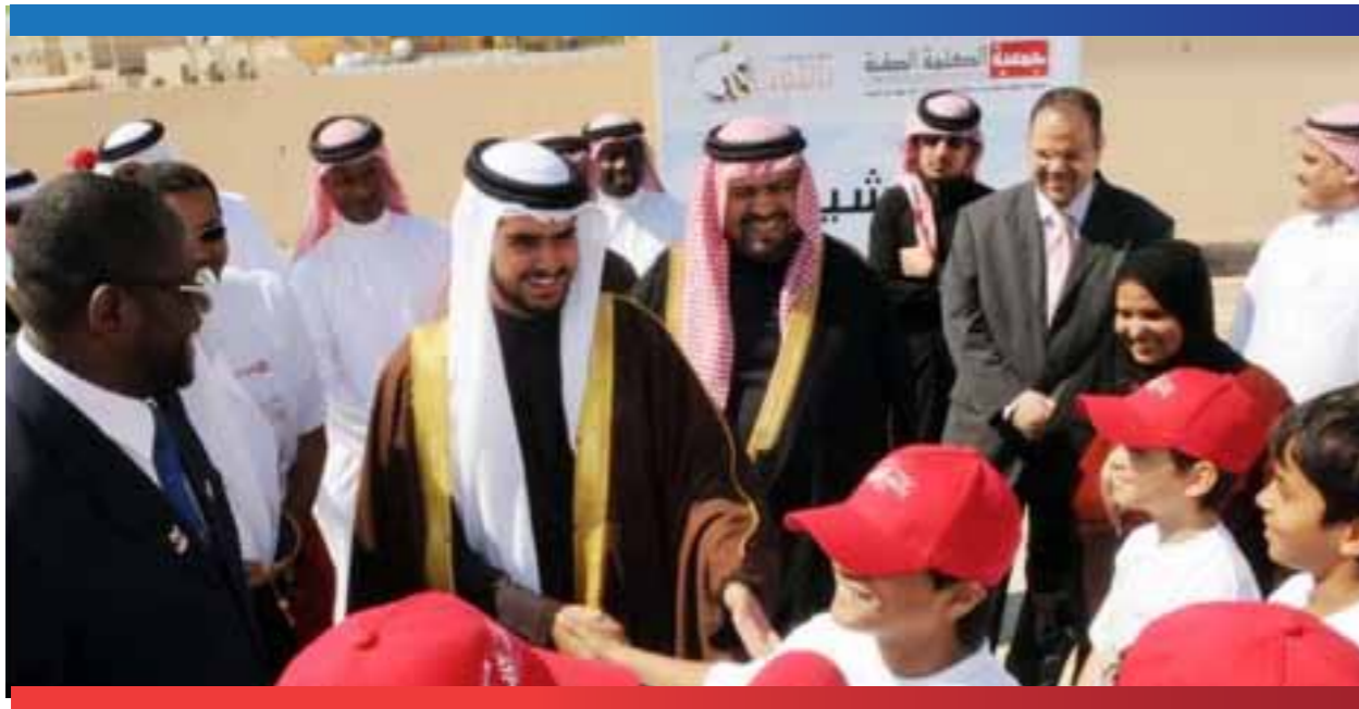
فعالية الرسم في حب الوطن في دوحة عراد

تم الاعتماد على الاستبيانات للتعرف على مدى قبول الفئة المستهدفة للبرنامج كما تم عمل استطلاع رأي بالنسبة لأولياء الامور، وقد وجدنا استحسان المشاركين في البرنامج كما شجعنا على الاستمرار في تنفيذ المزيد من هذه الأنشطة مع دراسة تطويرها بما يحقق أهداف المشروع.