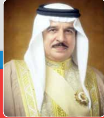
حضرة صاحب الجلالة الملك حمد بن عيسى آل خليفة ملك مملكة البحرين المفدى