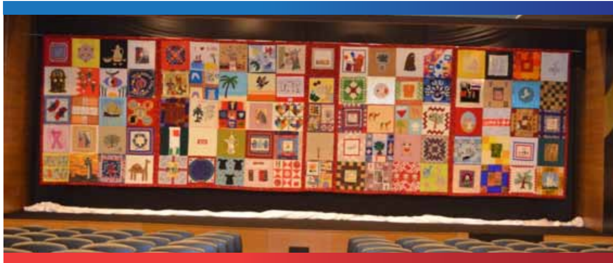
عرض ملحف البحرين (Bahrain Quilt)