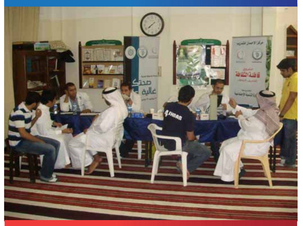
الطلبة المتدربون في قافلة التدريب المتنقل