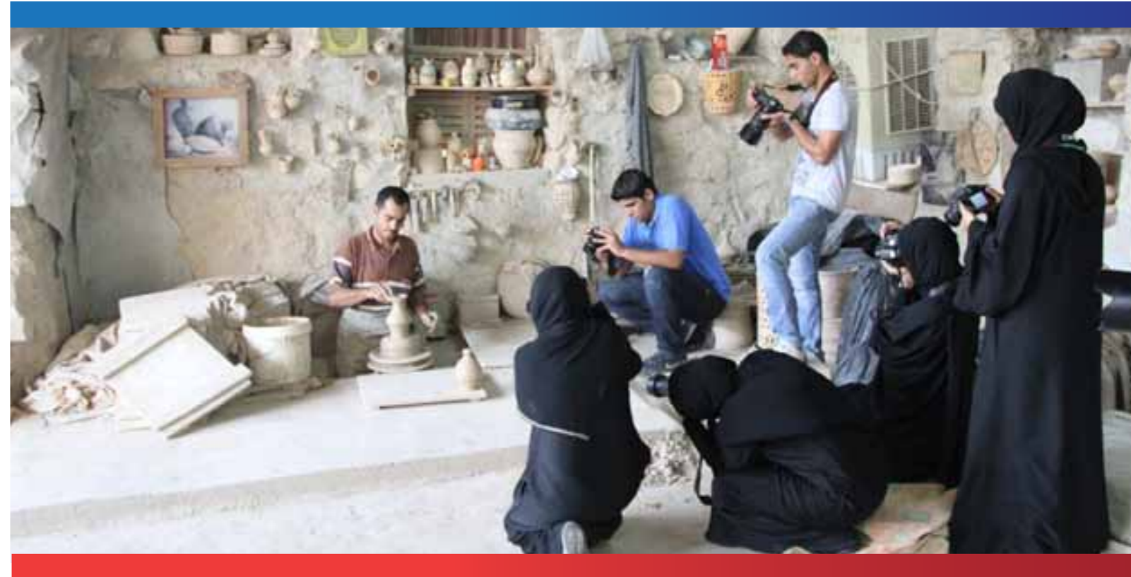
دورة التصوير الفوتوغرافي للمواقع الأثرية في البحرين