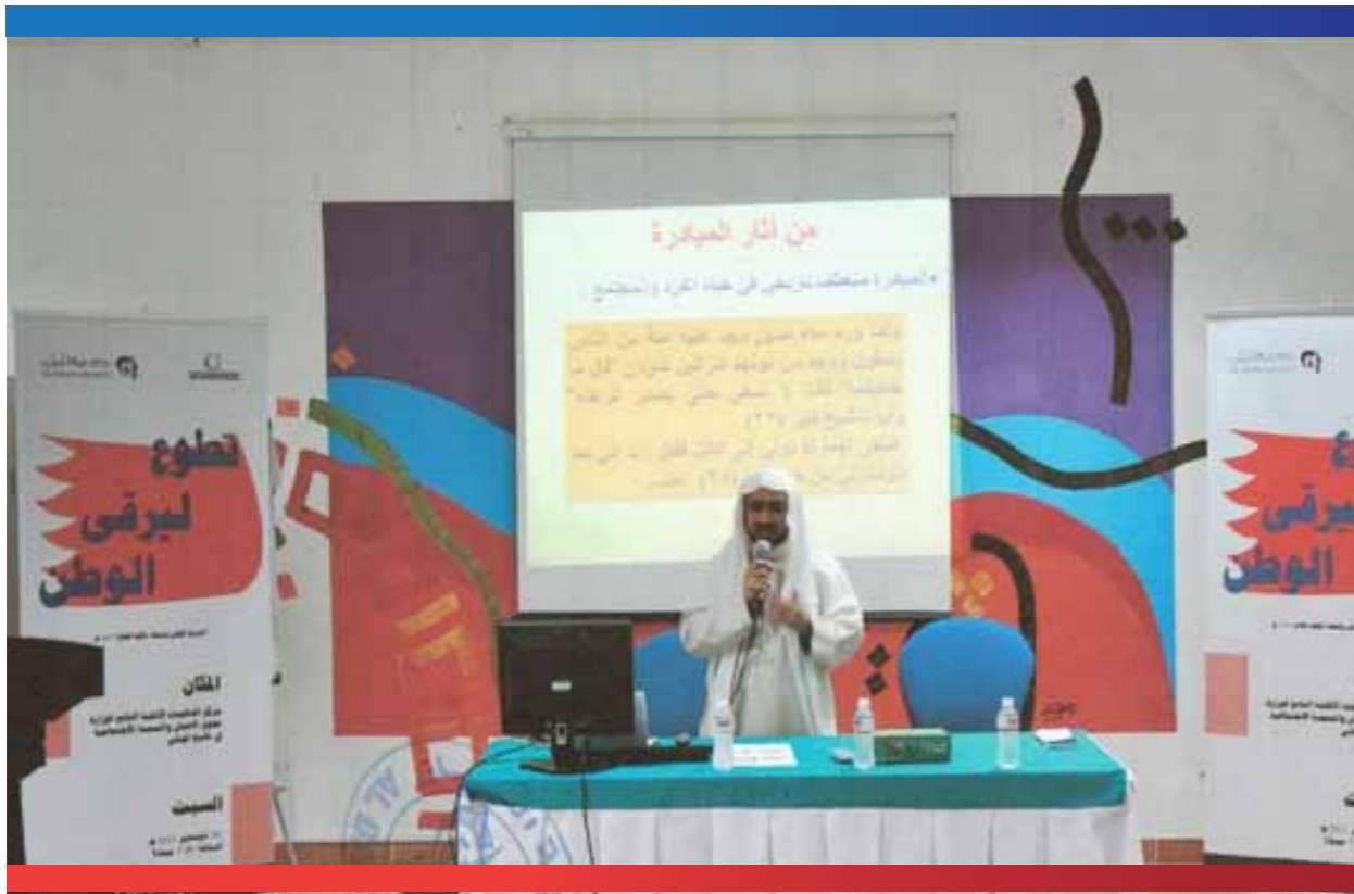
صور من فعاليات المشروعات التنموية لجمعية البيان

نوع التعاون والتنسيق مع جهات أخرى: تم التنسيق مع كل من وزارة التنمية الاجتماعية وجمعية توبلي الخيرية لاستخدام القاعات المتاحة في كل من مركز دعم المنظمات وصالة الجمعية كمقر احتياطي. كما تم التنسيق مع شركة المنيوم البيا بشأن توفير المحاضرين.