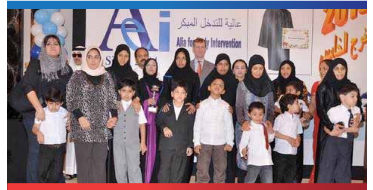
أطفال التوحد في حفل تخريج الفوج الخامس بمركز عالية للتدخل المبكر

مؤشرات فعلية (إحصاءات - مسح - استبيانات) حول مدى قبول الفئة المستفيدة وإقبالها والرضا عن البرنامج المنفذ قام المختصين بإجراء اختبارات تقييمية للتأكد من اكتساب المتدربين المهارات المطلوبة في المجال ومنحت جهات التدريب شهادات اجتياز متطلبات الدورة التدريبية للمختصين الذين اجتازوا اختبارات التقييم.