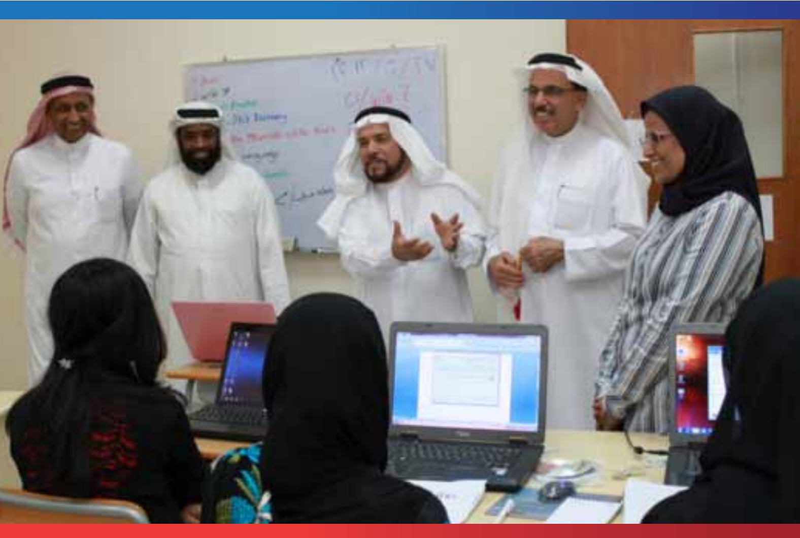
خبيرة المركز الوطني لدعم المنظمات في زيارة للمتدربات في برنامج تدريب المرأة على صيانة وبرمجة الحاسب الآلي.

مؤشرات فعلية (احصاءات - مسح - استبانات) حول مدى قبول الفئة المستفيدة واقبالها والرضا عن البرنامج المنفذ: لقد تواصل عدد كبير من الخريجات من المركز معنا ويتم حالياً تقديم جميع التسهيلات والدعم لهن من أجل اتخاذ هذه المهارة المكتسبة كحرفة لهن لها مردود مادي.