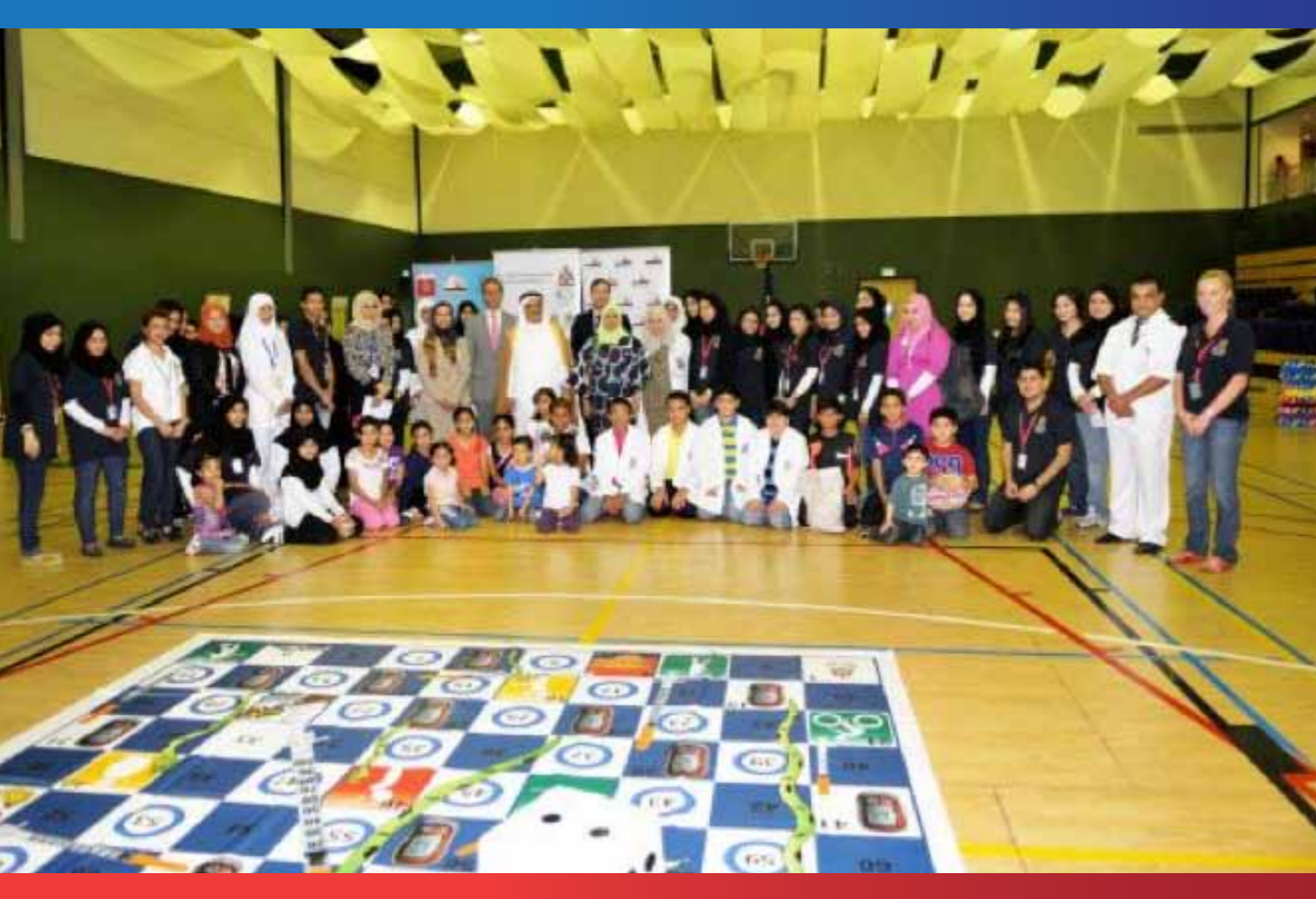
أطفال السكري في الجامعة الأيرلندية الملكية للجراحين