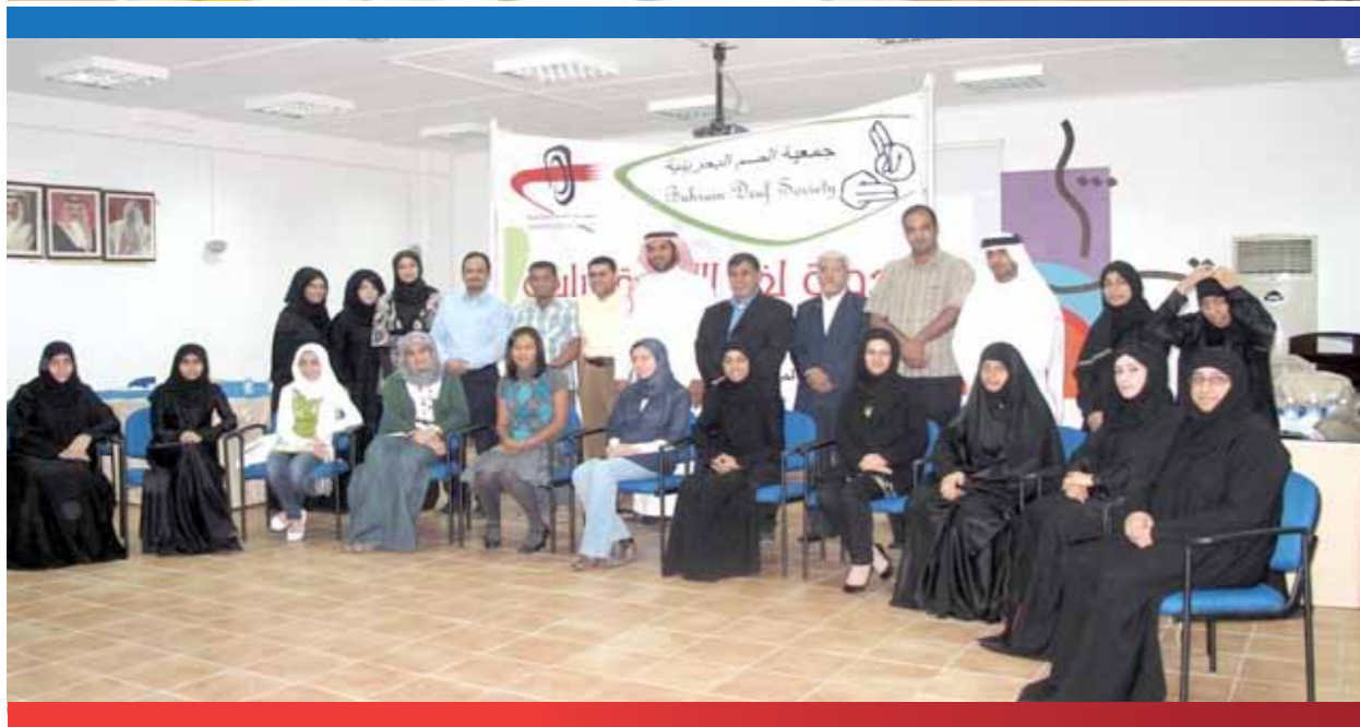
جمعية الصم البحرينية تتابع مشروعاتها وتختفل بانتهاء دورة لغة الإشارة تحت شعار مجتمع بدأ يسمع أصوات الصم