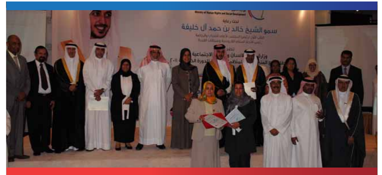
تكريم الجهات المانحة في حفل توزيع المنح المالية

الشركة العربية لبناء واصلاح السفن بقيمة ١٠ آلاف دينار في عام ٢٠١١ م.