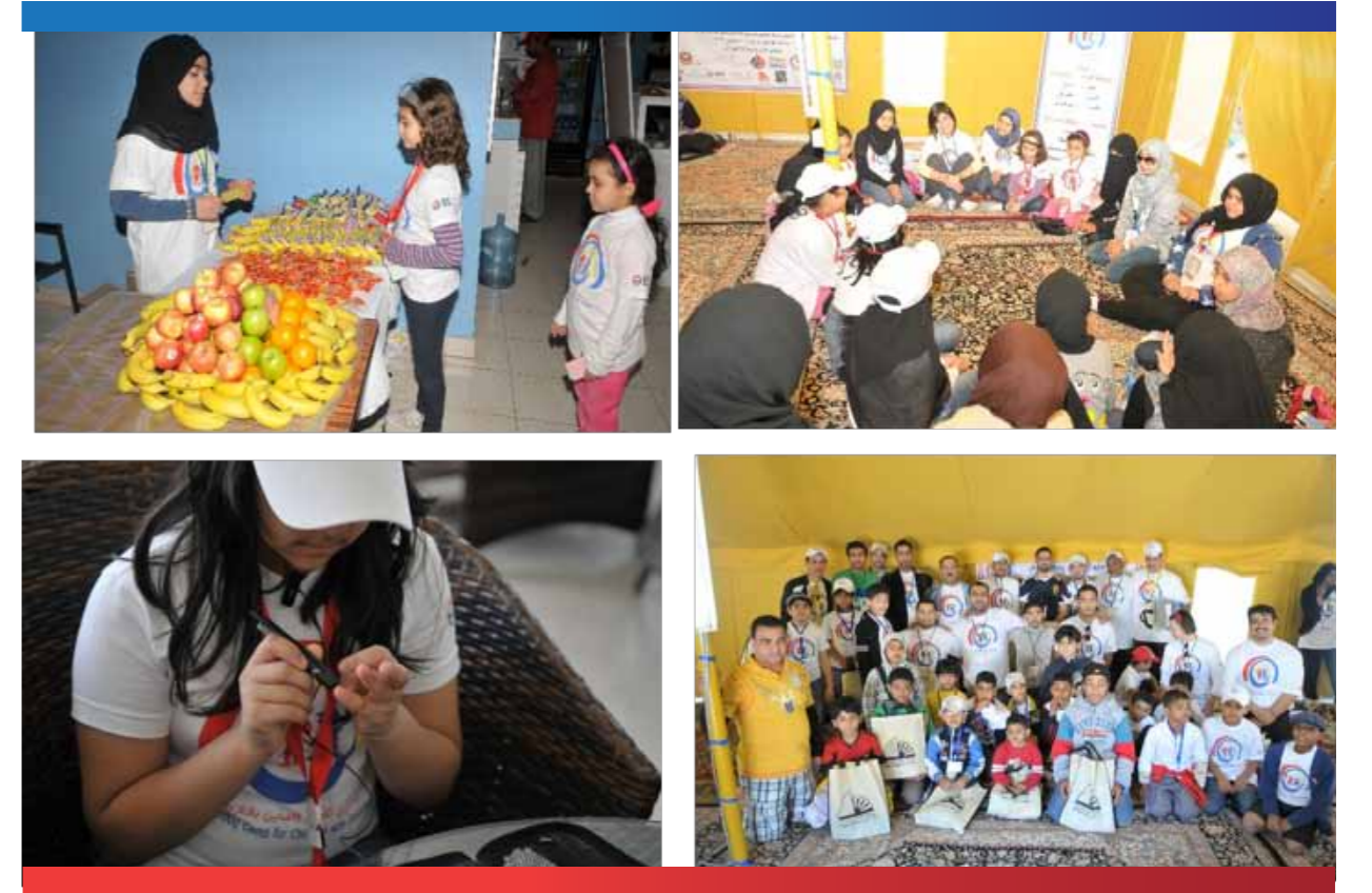
تدريب الأطفال على التعامل مع مرض السكري في مخيم شروق