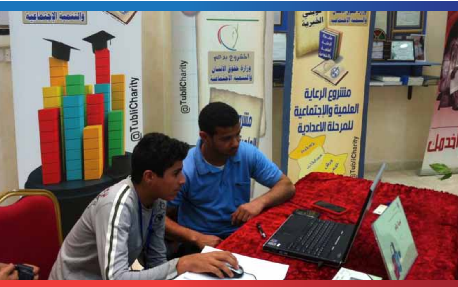
مشروع الرعاية العلمية للطلبة