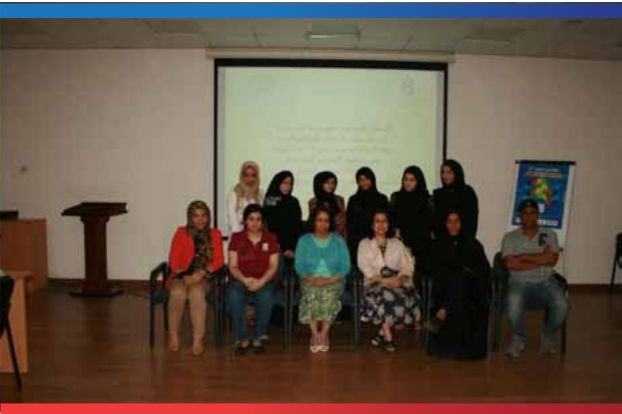
المتدربات في فن التصوير تحت شعار «البحرين في عيون الشباب»