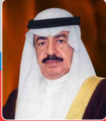
صاحب السمو الملكي الأمير خليفة بن سلمان آل خليفة رئيس الوزراء الموقر