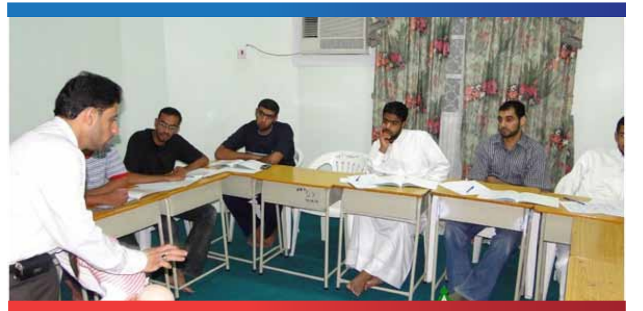
دورة الإسعافات الأولية