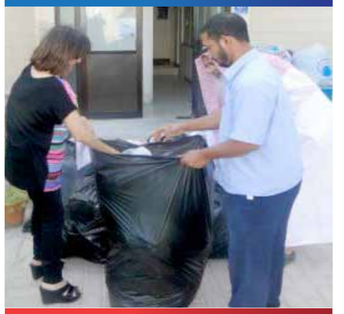
أولياء أمور المعاقين تطلق حملة «إعادة تدوير البلاستيك» لشراء الكراسي الخاصة