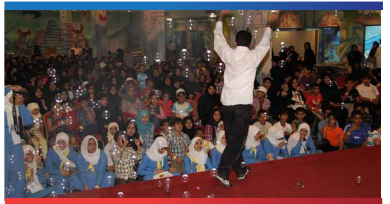
صورة لعرض مسرحية « قناع الشر » في منتزه عذاري بحضور عدد كبير من الجمهور وخاصة الأطفال