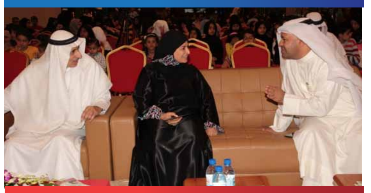
رئيس مجلس إدارة الجمعية مع الوكيل المساعد لتنمية المجتمع والوكيل المساعد للموارد البشرية أثناء عرض المسرحية

صعوبة التنسيق مع المجمعات التجارية للحصول على فرصة مناسبة للعرض المسرحي فضلاً عن المساحة المناسبة والميزانية التي تكفي التنفيذ.