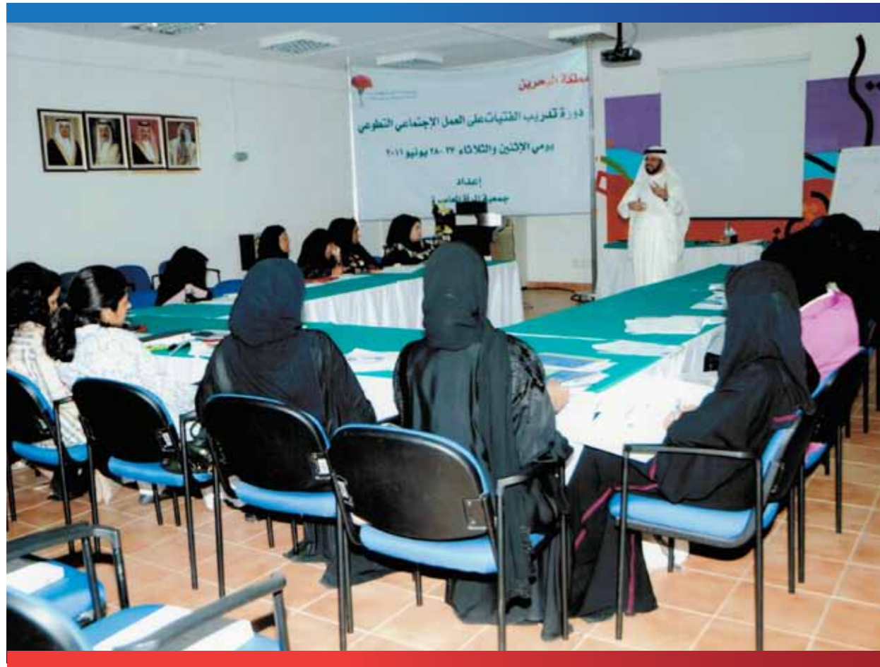
تدريب الفتيات على العمل التطوعي