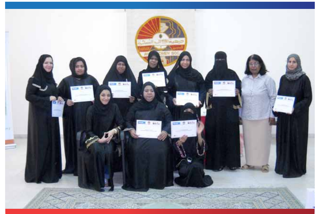
المتخرجات من ورشة تقنية المعلومات

عبارة عن تدريب الفتيات من الأسر المحتاجة على أصول الضيافة المنزلية وتوفير فرصة عمل لهن لتقديم خدمات الضيافة المنزلية للأسر البحرينية في المناسبات الاجتماعية المختلفة للأسر البحرينية. تبنت الجمعية مشروع الضيافة المنزلية لتدريب الفتيات على الضيافة المنزلية في أثناء المناسبات الاجتماعية كمناسبات الأفراح أو العزاء. وقد لاقى المشروع نجاحاً واضحاً واستقبله المجتمع البحريني النسائي بكل تشجيع مما جعل جمعيات نسائية أخرى تحذو حذو جمعية أوائل مثل جمعية الرفاع الثقافية الاجتماعية الخيرية.