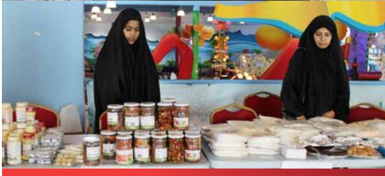
منتجات مشروع تمكين المرأة - جمعية المرخ