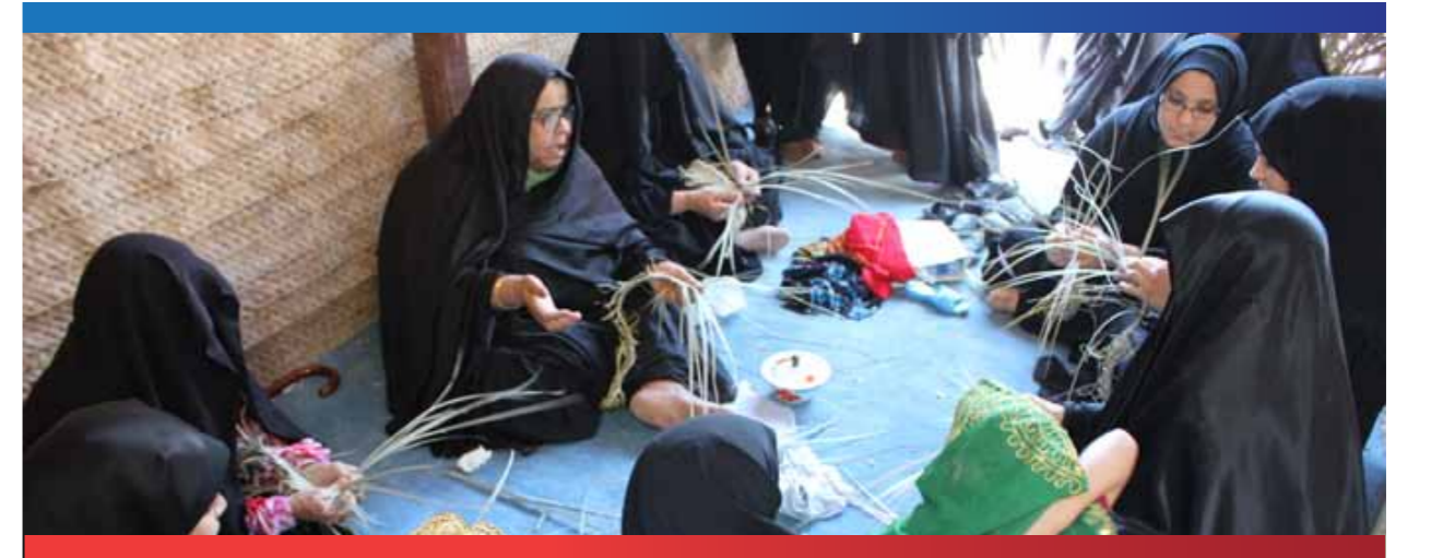
النساء المدربات والفتيات المتدربات في مشروع إحياء صناعة السفرة