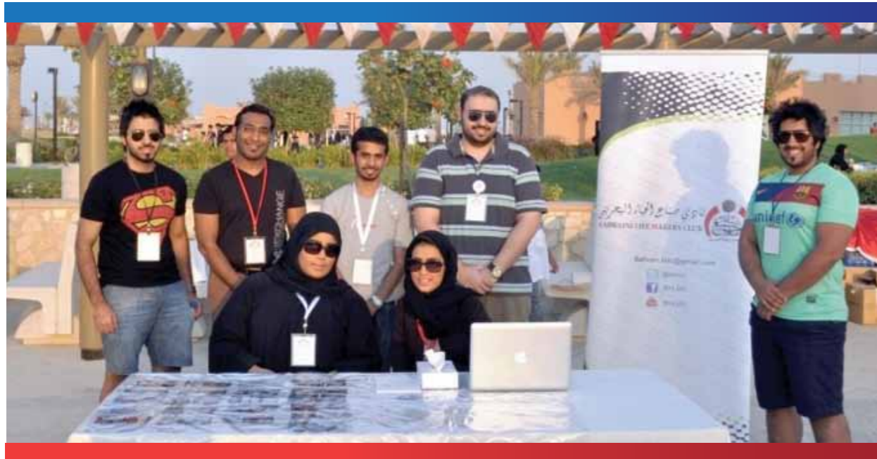
أحد فعاليات نادي صناع الحياة