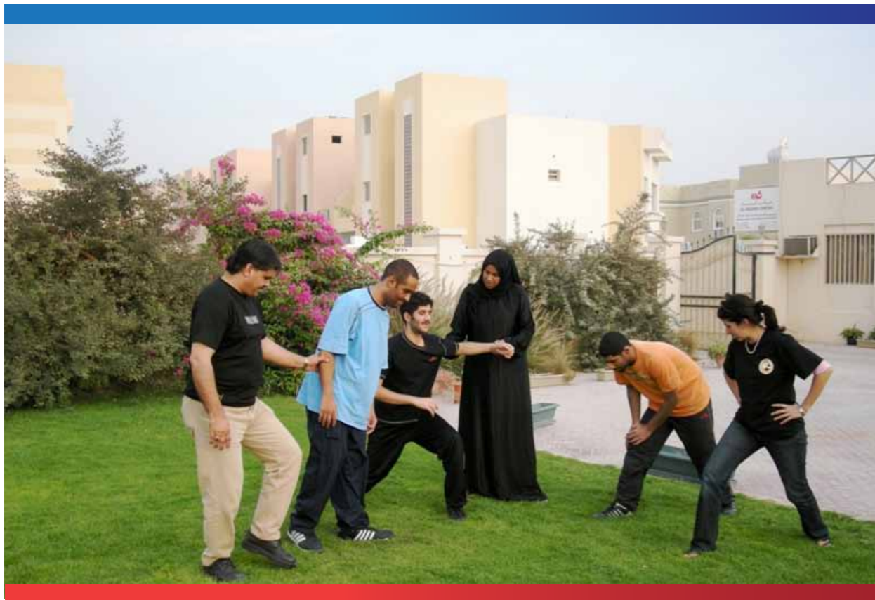
تدريب وتأهيل الشباب في مركز الرشاد

وتعمل الجمعية بشكل متواصل على دمج أطفال المعاقين من طلبة المراكز لديها في مدارس الحكومة مع وزارة التربية والتعليم. ويتضمن ذلك الدمج الكلي والدمج الجزئي. ويتم الدمج الجزئي لأيام محدودة في الأسبوع بالتعاون والتنسيق مع قسم التربية الخاصة بوزارة التربية والتعليم. أما الدمج الكلي فيتم بعد تأهيل الطلبة في المركز أكاديمياً واجتماعياً.