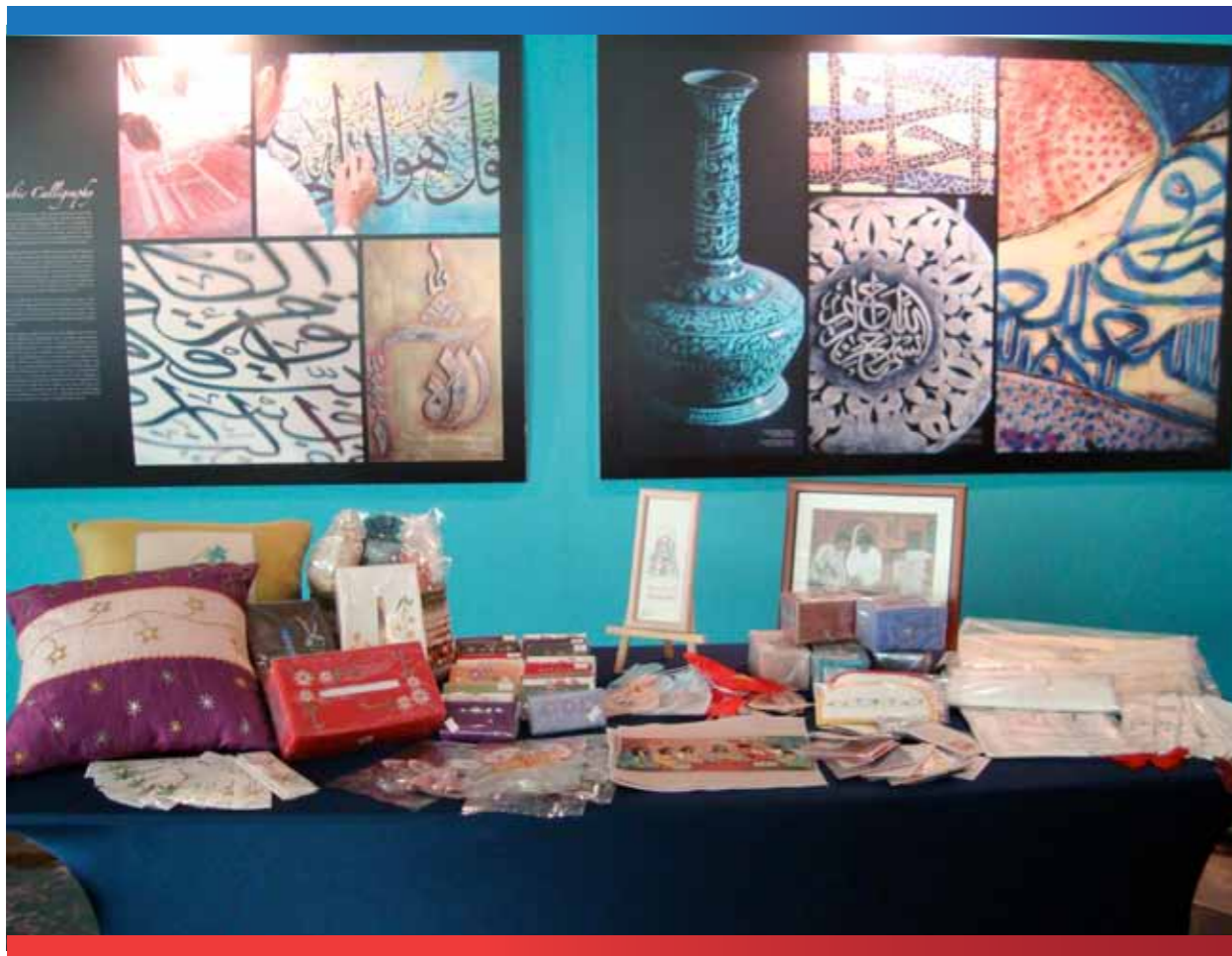
نماذج من المخرزات التراثية للجمعية