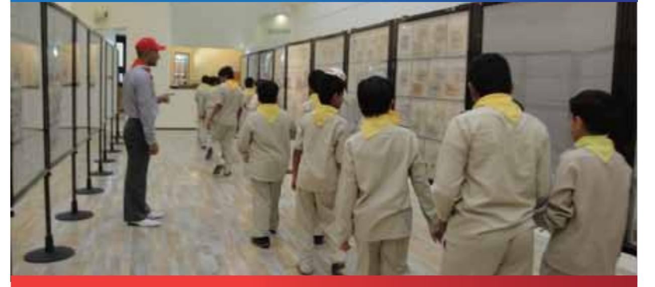
معرض الطوابع وزيارة للأشبال إلى المعرض