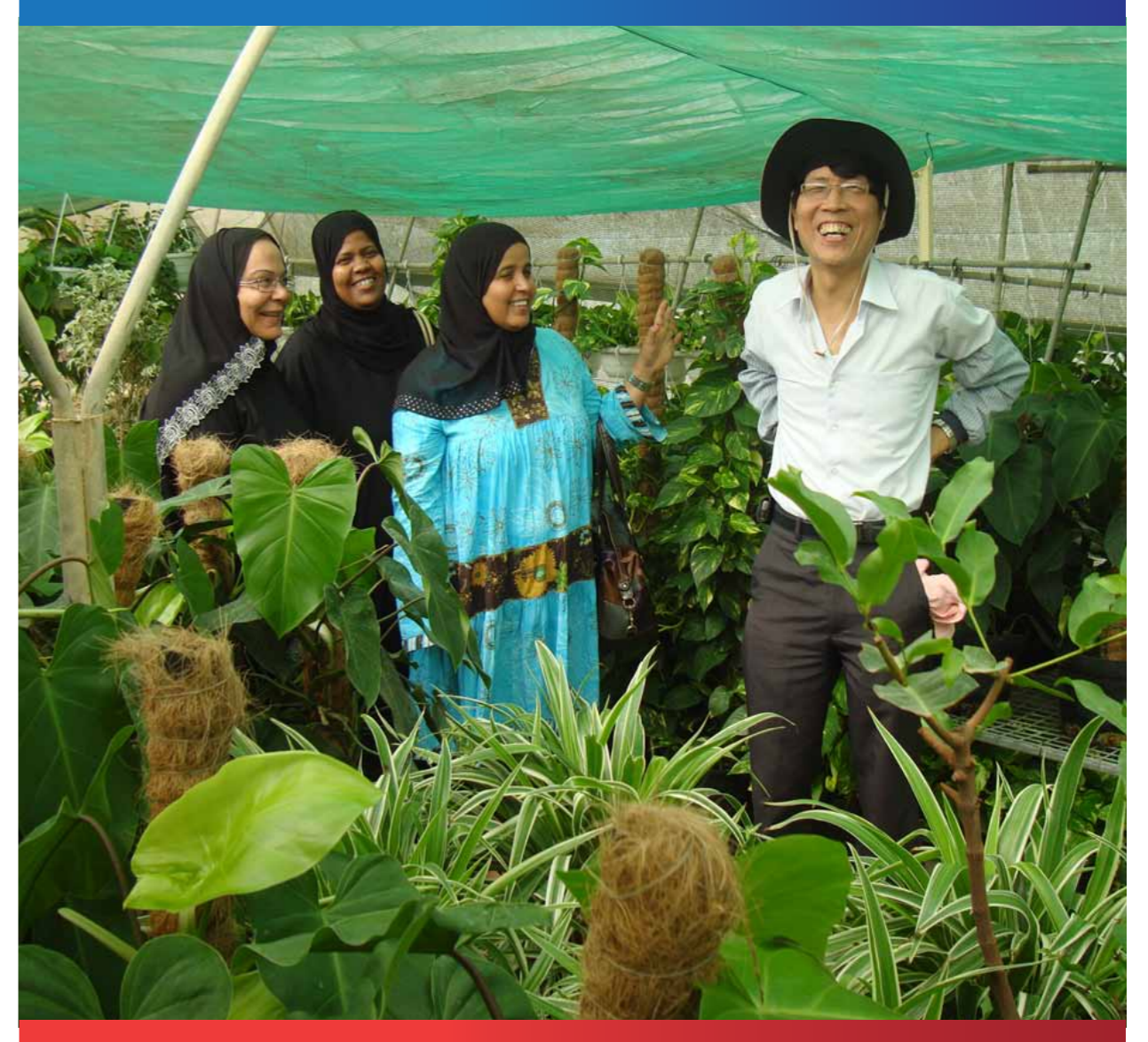
مشروع البيت الأخضر - جمعية الرفاع الخيرية الثقافية