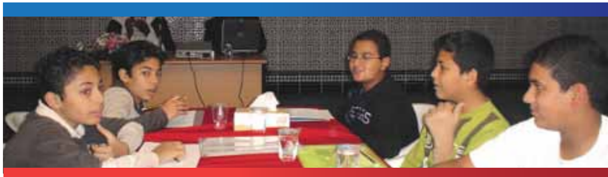
في أحد نشاطات واحة الناشئة

لاقت برامجنا اعجاب وقبول المجتمع بجميع فئاته المختلفة.