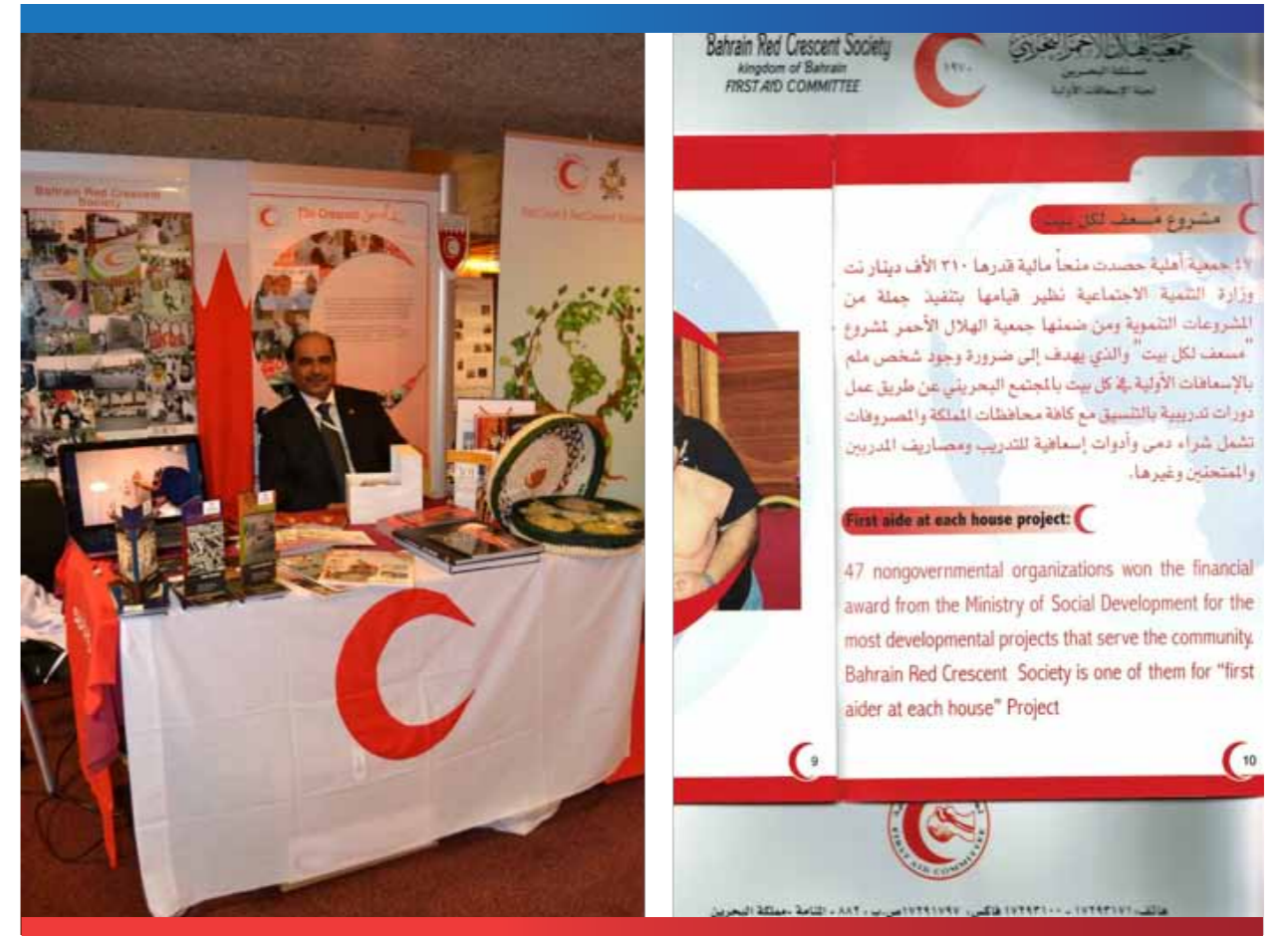
مشروع مسعف لكل بيت لجمعية الهلال الأحمر البحريني

تحصل الجمعية على ردود ايجابية دائماً من كافة الافراد المتدربين على الاسعافات الأولية ودرجة رضا عالية عن طريق التدريب والمدرسين ومواد التدريب.