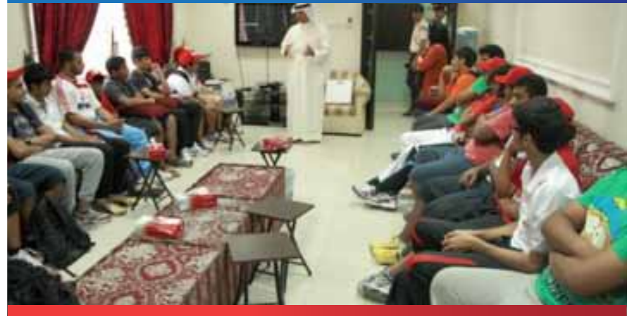
فعاليات جمعية الكلمة الطيبة برعاية الشيخ عيسى بن علي آل خليفة الرئيس الفخري للجمعية