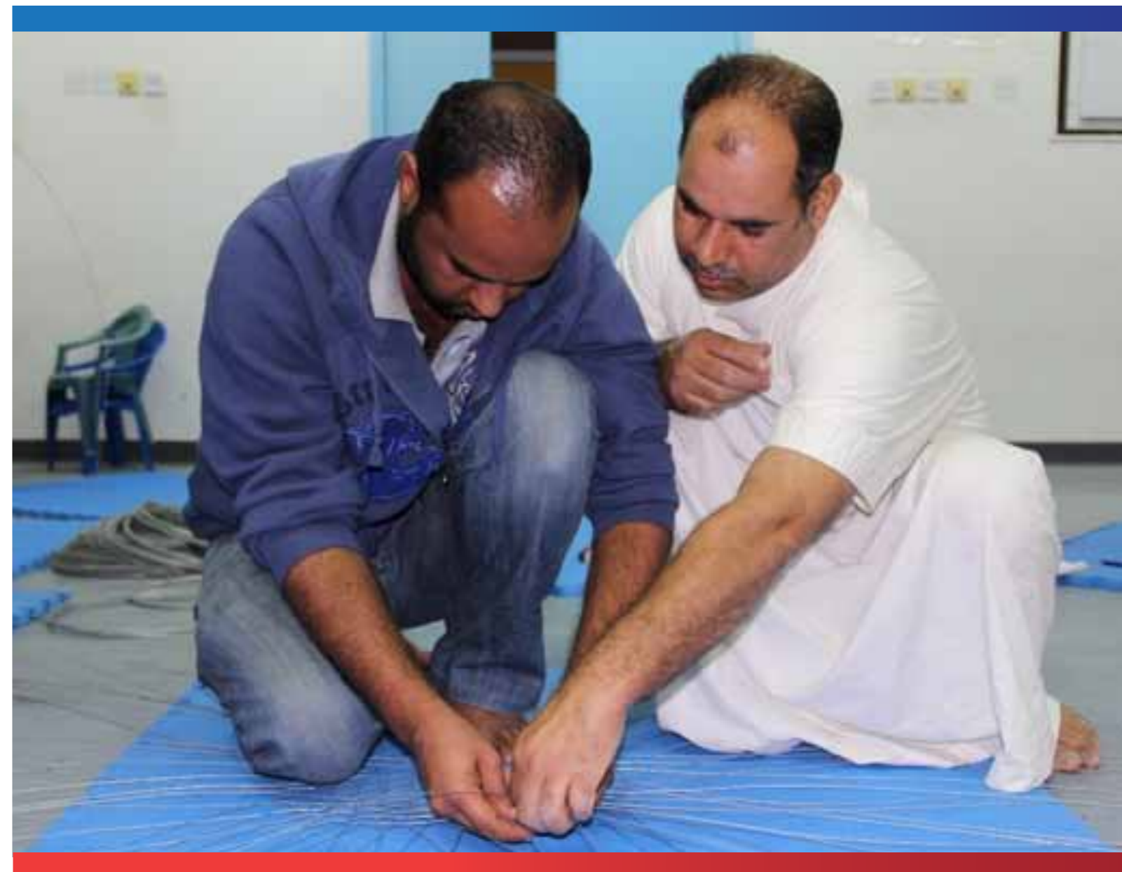
التدريب على صناعة القراقير

محدودية المكان الذي خصص للتدريب والرياضة مما حد من قبول أعداد من الراغبين في المشاركة. ندرة الكادر التدريبي خاصة من النساء. الإجراءات الروتينية للحصول على ترخيص لاستخدام الصالة الرياضية في أحد المدارس.