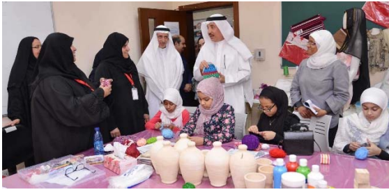
مركز عبدالله فخرو