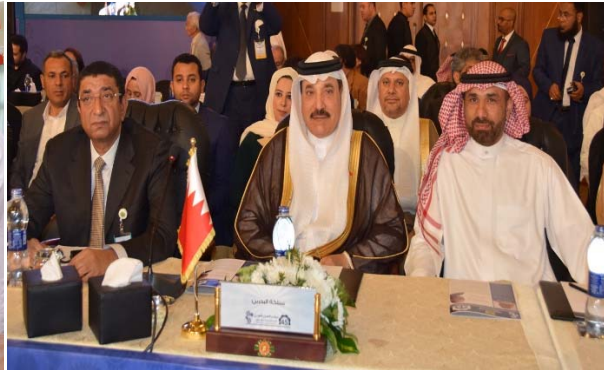
حميدان مترأساً وفد البحرين بمؤتمر العمل العربي