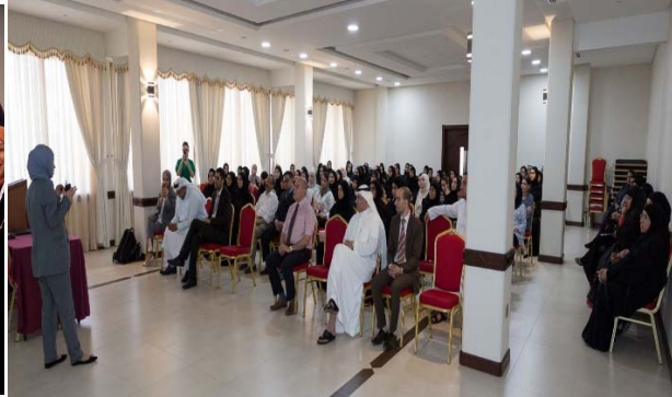
احدى لقاءات الباحثين عن عمل