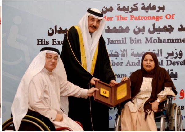
تكريم الفئات الداعمة لذوي الاعاقة