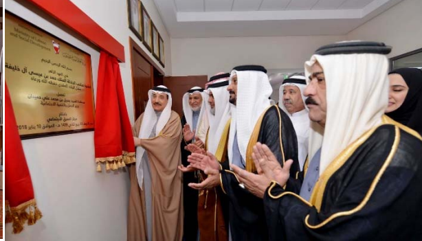
افتتاح مركز المحرق الاجتماعي