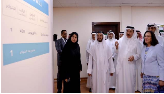
معرض التوظيف في القطاع الصحي