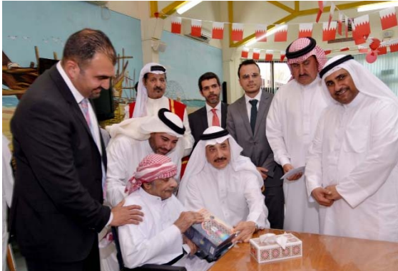
زيارة المسنين في العيد