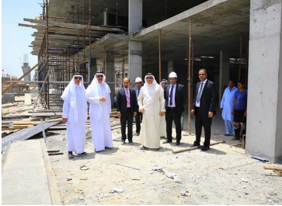
جولة الوزير الميدانية بمناسبة تطبيق نظام حظر العمل وقت الظهيرة