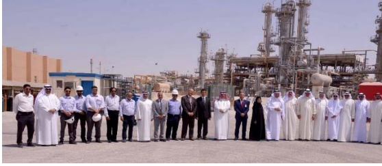
زيارة ميدانية لشركة بناغاز