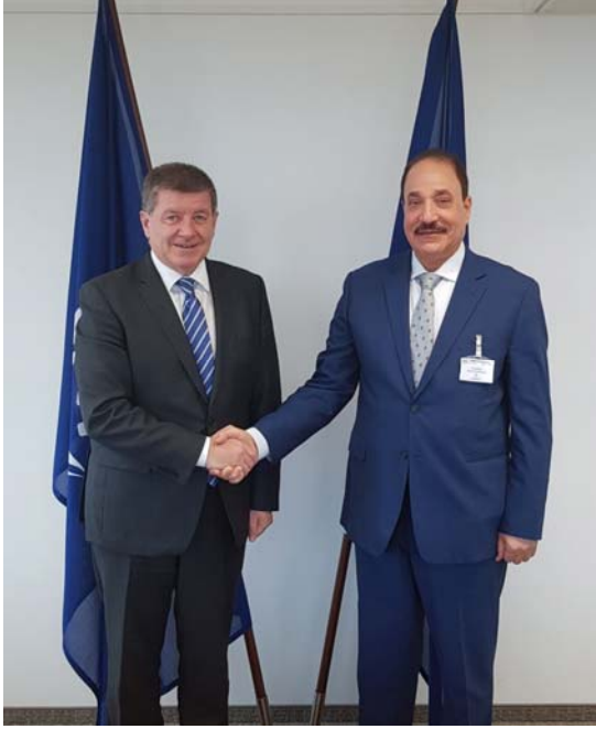
لقاء سعادة الوزير مع السيد جاي رايدر مدير عام منظمة العمل الدولية