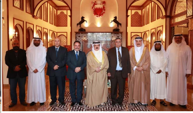
جلالة الملك المفدى يستقبل رئيس الاتحاد العام