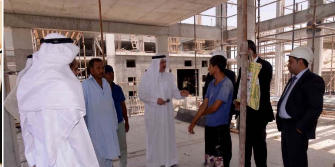
(2) قرار حظر العمل