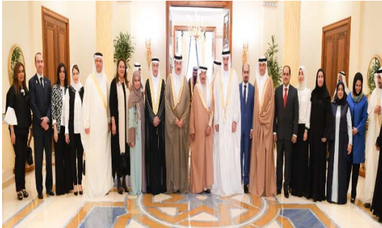
لقاء رئيس الوزراء للإدارة العليا