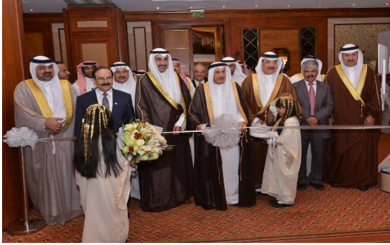
افتتاح مؤتمر السلامة المهنية

الاجتماع مع الاتحاد العام لنقابات عمال البحرين