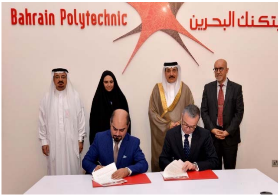
توقيع مذكرة تفاهم مع كلية البحرين التقنية البوليتكنيك 8