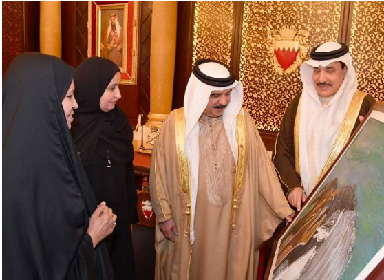
لدى استقبال العاهل المفدى للإدارة العليا وعدد من منتسبي الوزارة