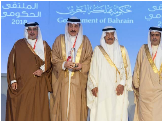
فوز هيئة تنظيم سوق العمل بجائزة أفضل الممارسات الحكومية