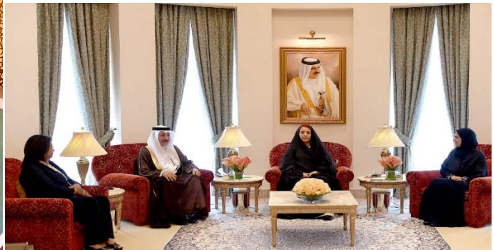
قرينة العاهل المفدى تستقبل مجلس إدارة الاتحاد النسائي الجديد