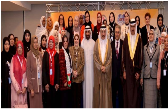
افتتاح الملتقى النقابي للمرأة العربية