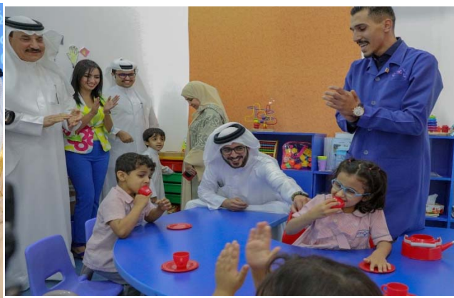
سمو الشيخ خالد بن حمد آل خليفة يزور مركز دانة للتربية الخاصة