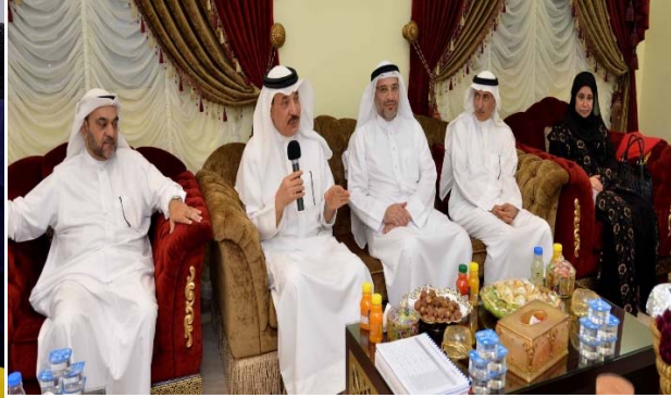
زيارة أهالي مدينة حمد