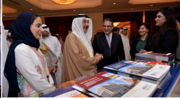
معرض البحرين للتدريب ما قبل العمل