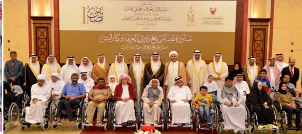
مبادرة تضامن مع ذوي العزيمة وكبار السن