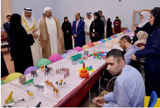
زيارة مراكز الرعاية والتأهيل الاجتماعية