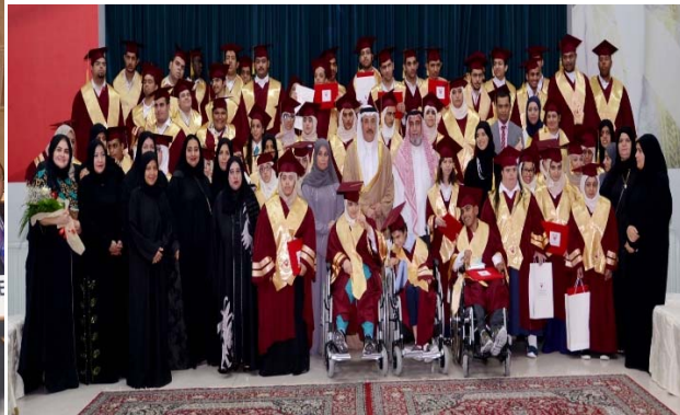
حفل تخريج الفوج 19 لطلبة وطالبات المراكز التأهيلية والأكاديمية والمهنية