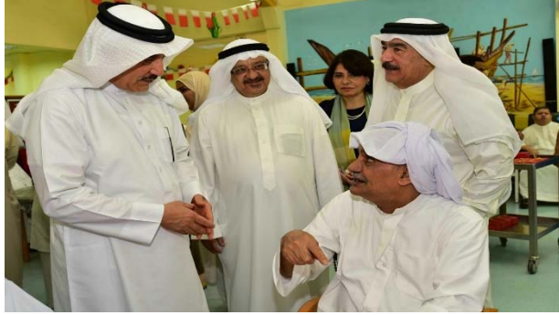
زيارة وزير العمل والتنمية الاجتماعية لدار بنك البحرين الوطني للمسنين