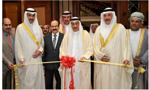
معالي الشيخ خالد بن عبد الله يرعى افتتاح أعمال المؤتمر والمعرض الوطني الثالث للسلامة والصحة المهنية