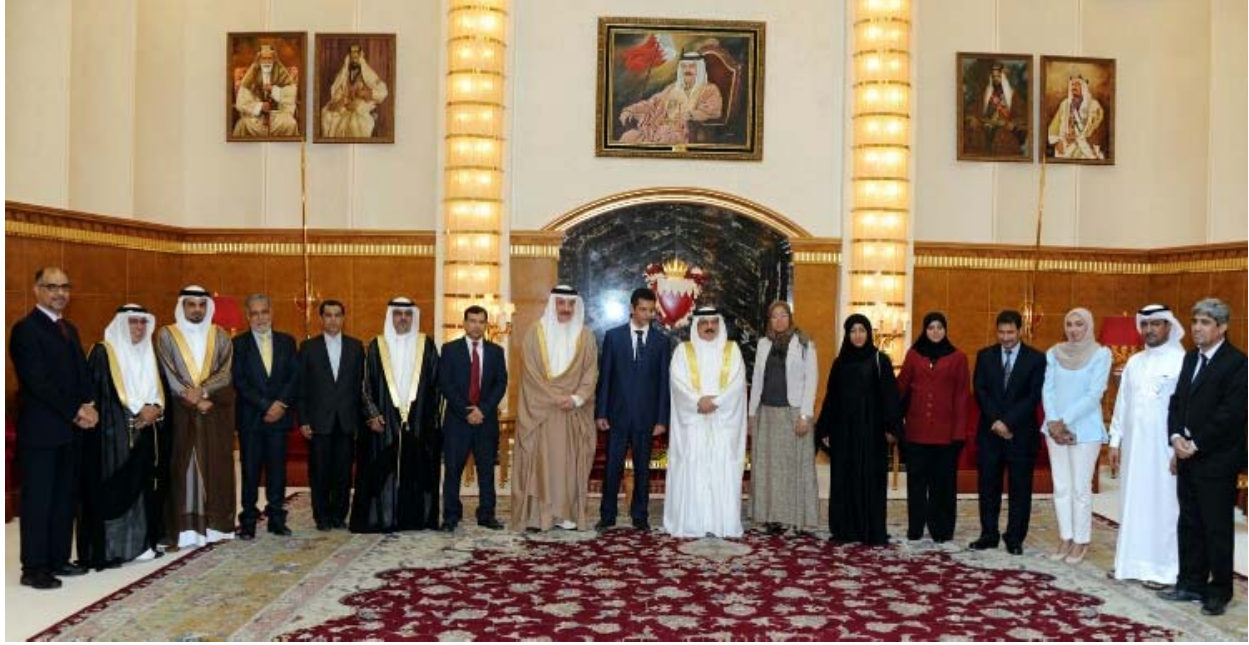
من لقاء جلالة الملك للامانة العامة الجديدة المنتخبة للاتحاد العام لنقابات عمال البحرين

وزير العمل والتنمية الاجتماعية يشارك بملتقى المرأة الخليجية العاملة