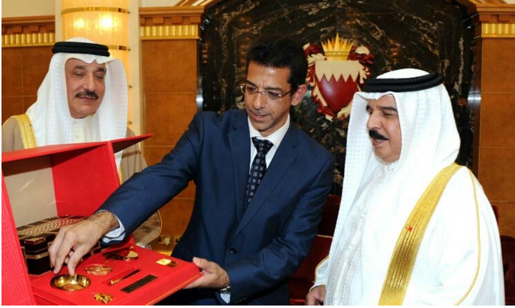
جلالة الملك يلتقي الامانة العامة الجديدة المنتخبة للاتحاد العام لنقابات عمال البحرين