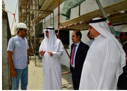
جولة تفقدية لتطبيق قرار حظر العمل وقت الظهيرة