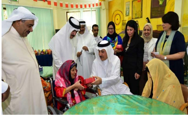
زيارة وزير العمل والتنمية الاجتماعية لدار بنك البحرين الوطني للمسنين