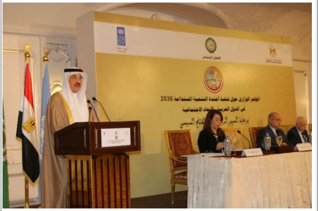
من مؤتمر تنفيذ أجندة التنمية المستدامة 2030 في الدول العربية الابعاد الاجتماعية