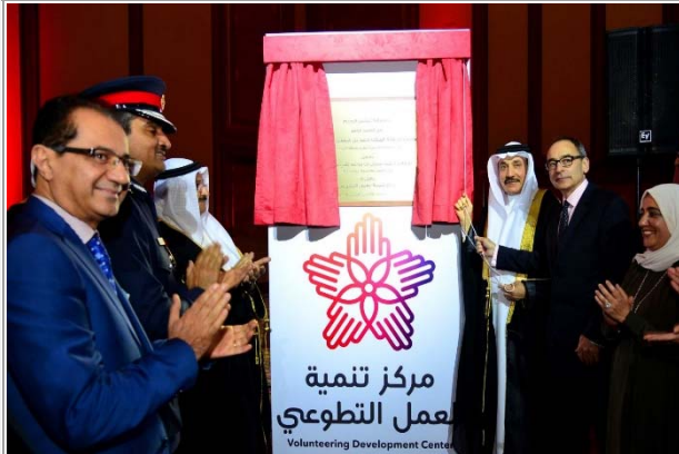
افتتاح مركز المتطوعين