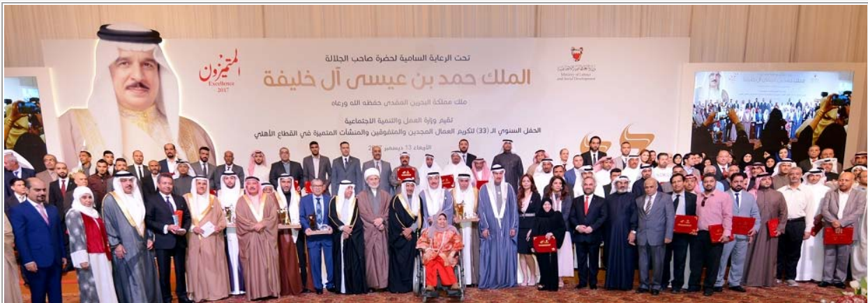
المكرمون في حفل تكريم العمال المجددين برعاية العاهل المفدى