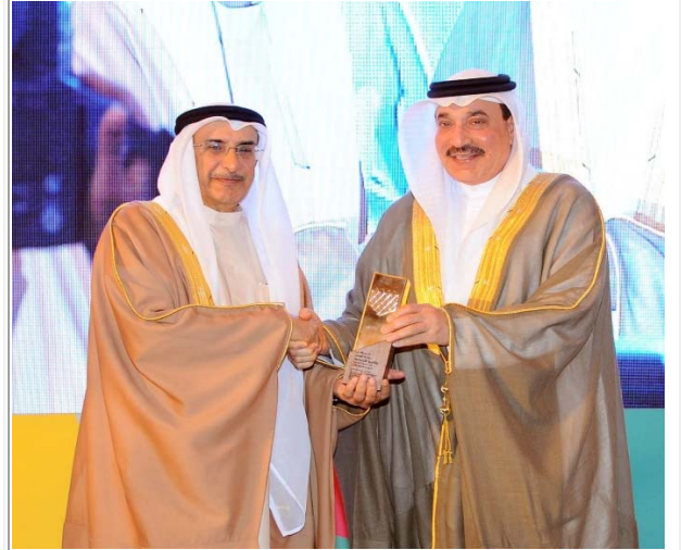
معالي نائب رئيس مجلس الوزراء يكرم وزارة العمل والتنمية الاجتماعية بالملتقى الأول لمؤسسة المبرة الخليفة