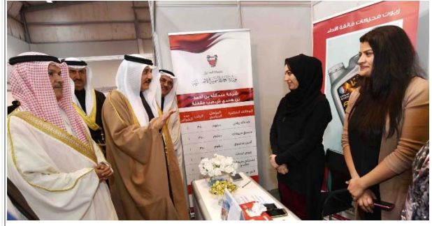
لدى افتتاح معرض السيارات في سترة