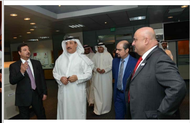
أحد الزيارات الميدانية لشركة نفط البحرين