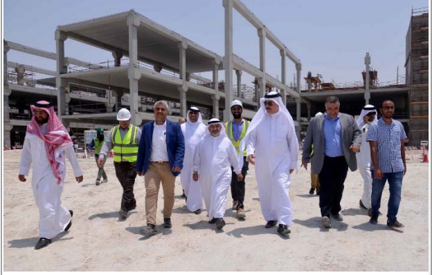
جولة تفقدية خلال حظر العمل وقت الظهيرة