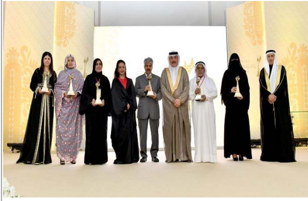
الفائزون بجائزة سمو الأميرة سبيكة لتشجيع الأسر المنتجة