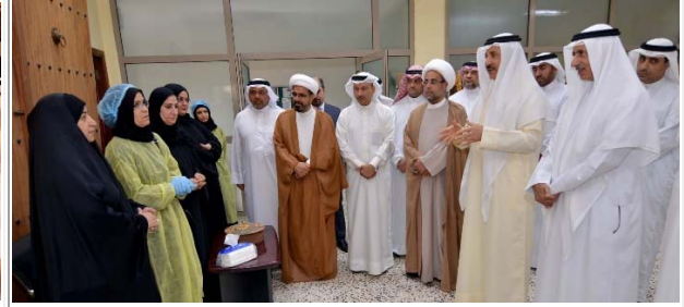
زيارة تفقدية لمركز سترة للأسر المنتجة