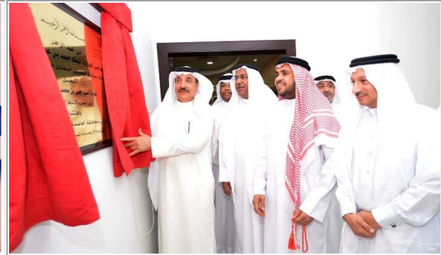
افتتاح مركز جديد للتوظيف والتدريب في المنامة