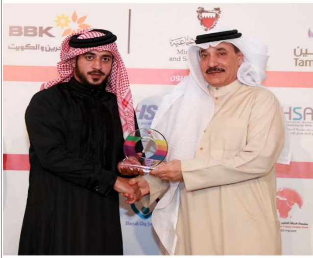
تكريم وزارة العمل والتنمية الاجتماعية في ملتقى تكنو لا إعاقة من قبل سمو الشيخ خالد بن حمد آل خليفة