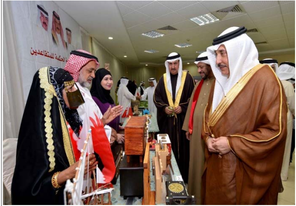
مشاركة كبار السن