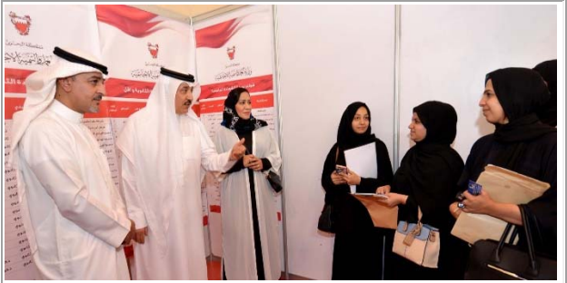
لقاء الباحثين عن عمل