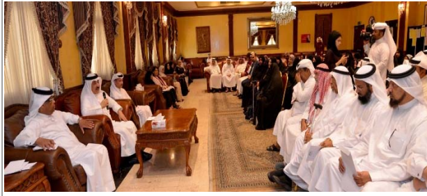
جانب من لقاء أهالي أم الحصم