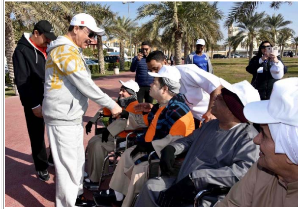
مشاركة ذوي الإعاقة بإحدى الأنشطة الترفيهية