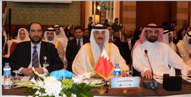
مشاركة البحرين بمؤتمر العمل العربي بالقاهرة