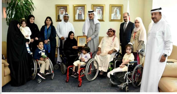
لقاء أفراد من ذوي الإعاقة