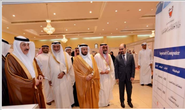
افتتاح معرض المحرق للتوظيف