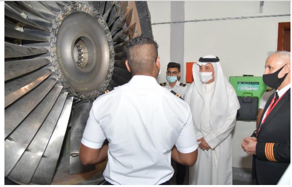
توقيع إتفاقية مع شركة خدمات مطار البحرين