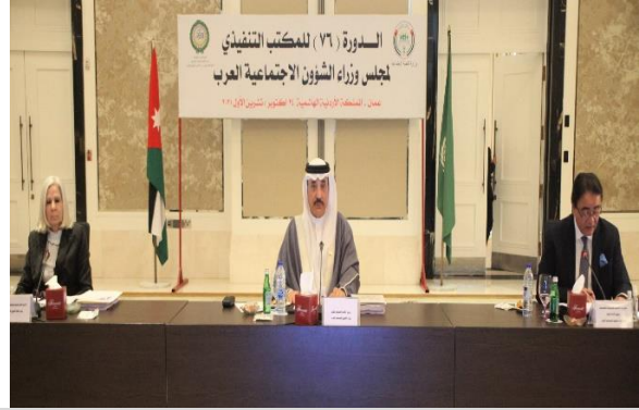
حميدان يتأسس أعمال دورة مجلس وزراء الشؤون الاجتماعية العرب بالأردن