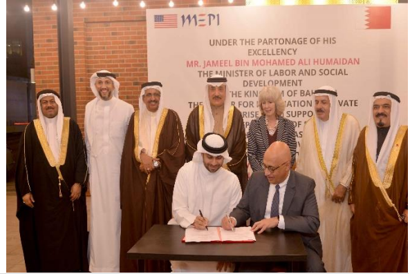
تدشين مشروع حول التنوع الاقتصادي في مملكة البحرين