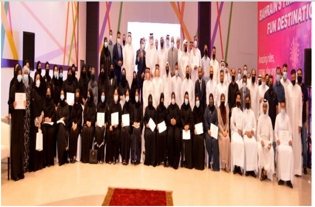
حفل توظيف 198 بحرينياً بأحدى ممشآت القطاع الخاص