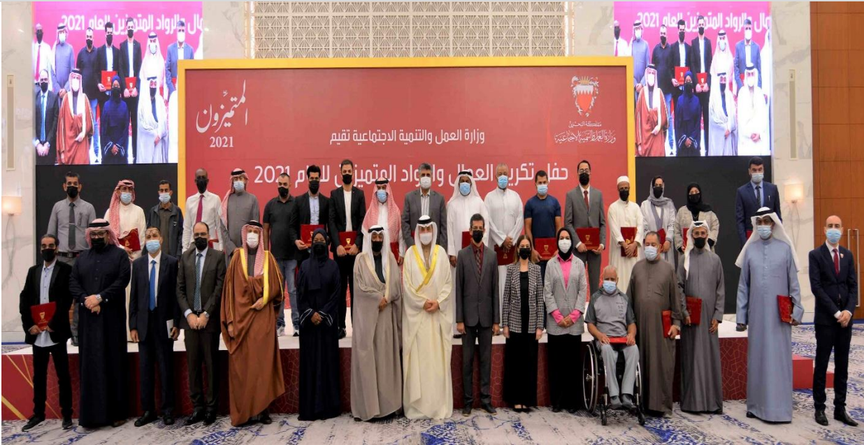
حفل تكريم العمال والرواد المتميزين 2021