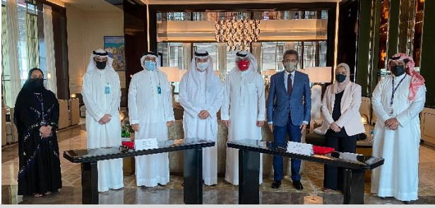
مذكرة تفاهم مع شركة مطار البحرين للتدريب على رأس العمل