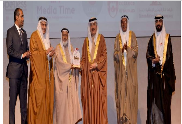
يوم التطوع الدولي 1