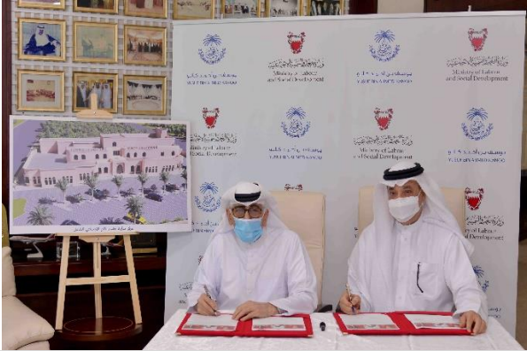
توقيع الاتفاقية مع شركة كائولبناء مركز اجتماعي شامل في محافظة العاصمة