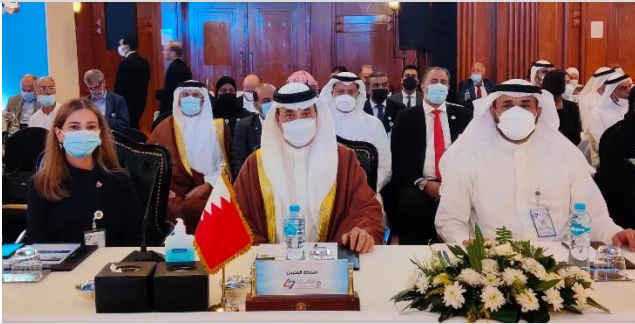
وزير العمل والتنمية الاجتماعية يتأسس وفد مملكة البحرين المشارك في أعمال مؤتمر العمل العربي