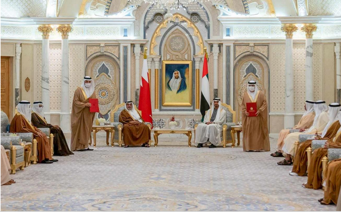
توقيع البحرين والإمارات مذكرة تعزيز التعاون الفني وتنمية الموارد البشرية