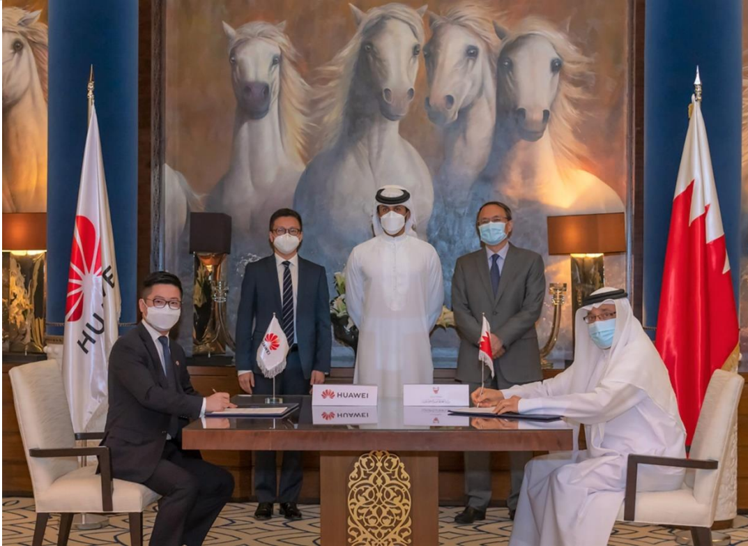
توقيع مذكرة التعاون مع هواوي