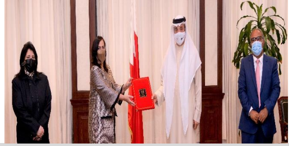
توقيع مذكرة تفاهم بين الوزارة والهيئة الوطنية لتنظيم المهن والخدمات الصحية