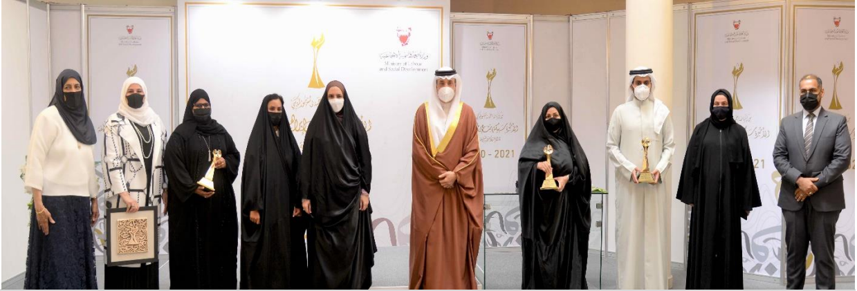
جائزة صاحبة السمو الملكي الأميرة سبيكة بنت إبراهيم آل خليفة لتشجيع الأسر المنتجة