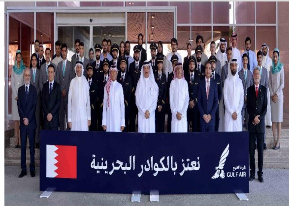
توظيف 50 بحرينياً في شركة طيران الخليج