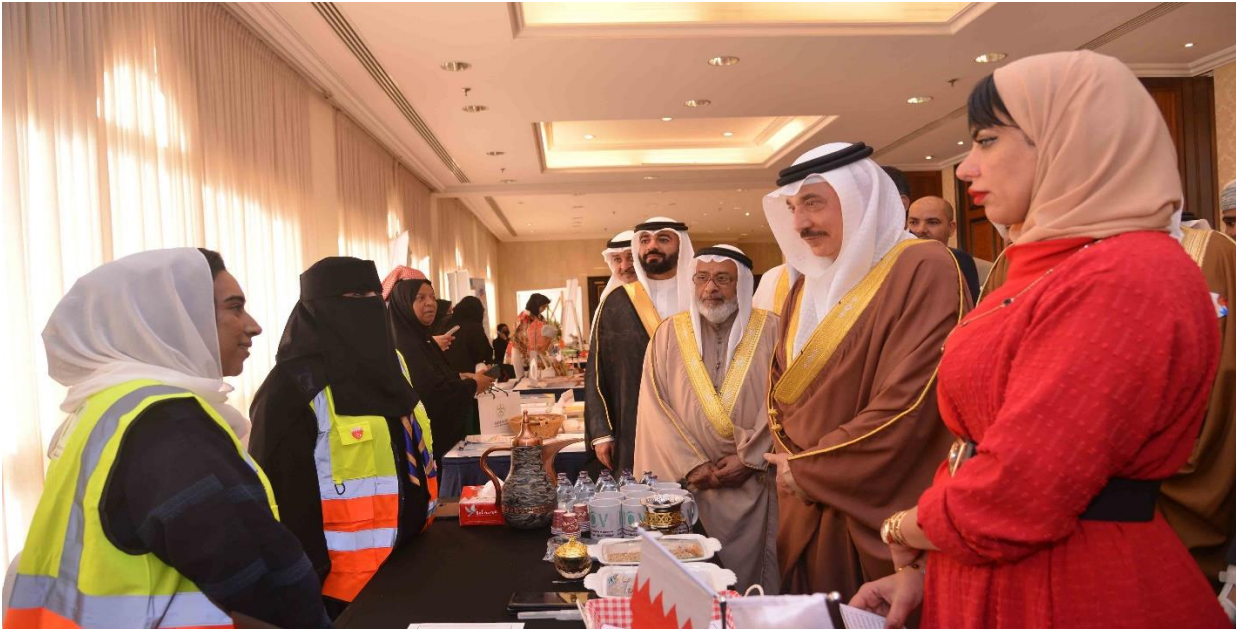
يوم التطوع الدولي 3