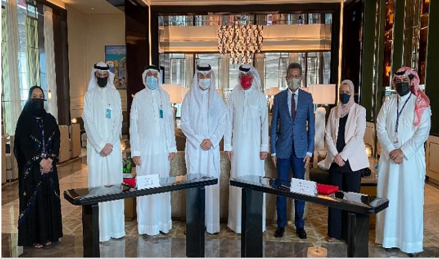
مذكرة تفاهم مع شركة مطار البحرين للتدريب على رأس العمل