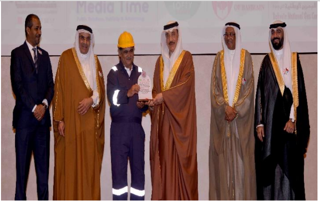
يوم التطوع الدولي 2