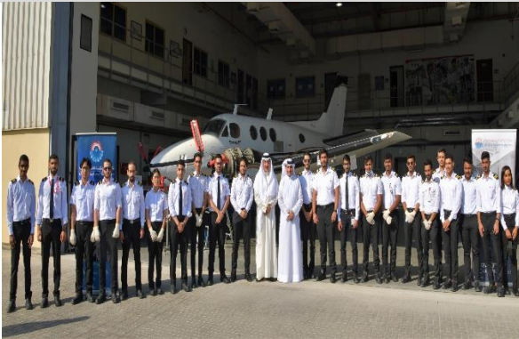
توقيع إتفاقية مع شركة خدمات مطار البحرين2